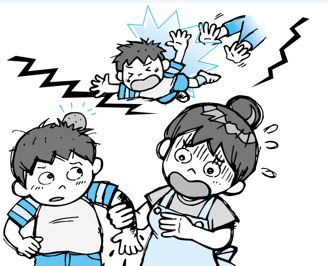
(イラスト/村松麗子)

しかし実際には、このようなことが起こったときに子どもから話を聞くことは、なかなか難しいものです。まず、子どもの側の要因として、そのときのようすをしっかりと見えていなかったり、忘れてしまったり、友達と話しているうちに、実際に自分が体験したことなのか、人から聞いたことなのか、わからなくなることもあります。