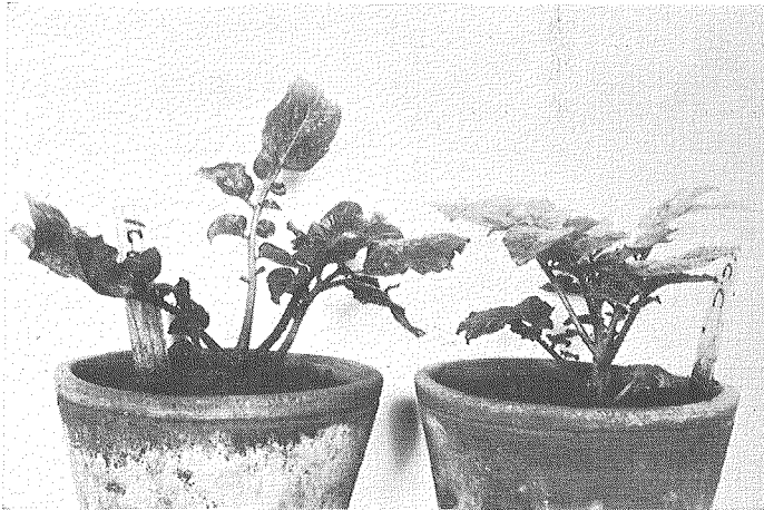
第1圖 X線照射漣葉モザイク病薯より生じた畸形植物(右はその對照植物)