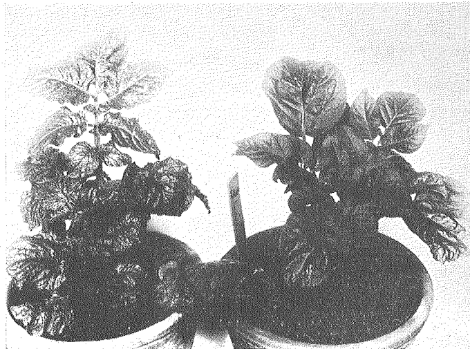
第2圖 X線照射漣葉モザイク病薯より生じた甚しく縮葉せる植物(右はその對照植物)