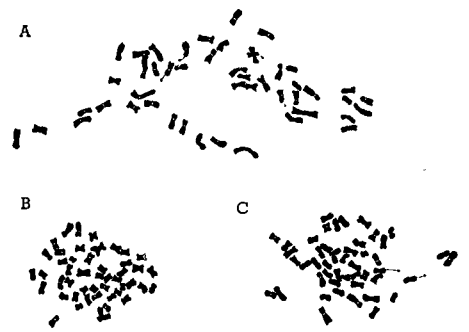
A: 同質四倍体 S. laplaticum 体細胞染色体, 2n=48 B: 複二倍体-23 体細胞染色体, 2n=48 C: 複二倍体-39 体細胞染色体, 2n=48 (全図約 1000 倍)

複二倍体系統の親二倍種 S. laplaticum BUK. ( Commer-soniana 群), S. stenotomum JUZ. et BUK. ( Tuberosa 群) 及び同質四倍体 S. laplaticum は北海道農業試験場より塊茎で分譲されたものであり、四倍体は S. laplaticum の自然結果種子をコルヒチン処理した系統である。