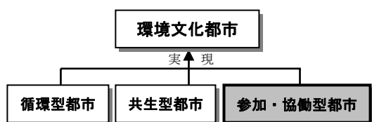
図-2 環境都市像の体系的整理と追加

環境都市像は、良好な環境の保全と創造をめざした都市づくりの将来像であり、市民・企業・行政が共有する目標である。改定計画では、図-2に示すとおり、札幌がめざす環境都市像を「環境文化都市」とし、その実現に向けてさらに3つの都市像（「循環型都市」「共生型都市」「参加・協働型都市」）を設定した。このうち、「参加・協働型都市」は、市民・企業・行政が協働で環境保全・創造活動を推進する将来像を明確にするため、新たに設定した。