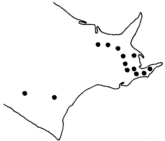
Fig. 1. The map of eastern Hokkaido showing sampling sites(dot in figure) of ecotype.

北海道東部地方の路傍、荒廃草地、古い牧野より採集された生態型13系統(第1図)と、センボク、北見1号、北見3号の育成品種3系統、合計16系統を供試した。1976年5月15日に水稻の株播き用バットに播種し、約1ヶ月後の本葉3ないし4葉の展開の時期に圃場に移植した。1列1系統10個体を畦間75cm株間50cmの個体植えにし、試験は2反復の乱塊法で行なった。移植に先だって圃場に施肥しなかった。