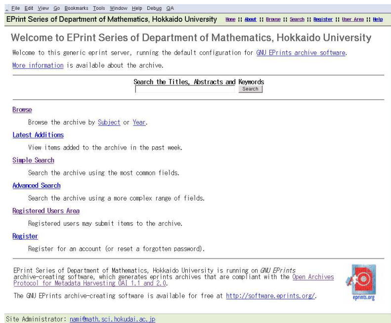
図 2: EPrints のスタートページ