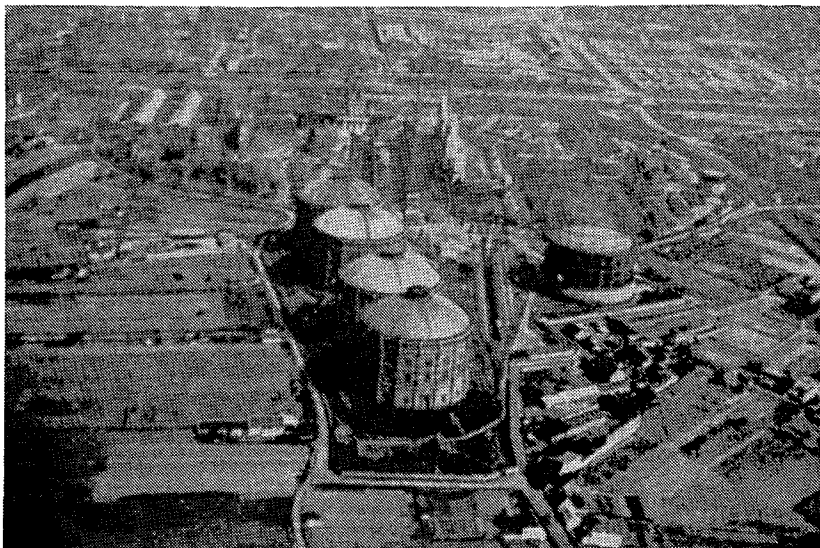
手前がガス工場、左上の煙突が発電所

八九七年には、延べ一―二キロにも達していたとは言え、そのうちの一一〇キロは馬車によるものであって、非効率で連絡も悪い上、料金も高く、市民に不評であった。 (13) しかも、苛酷な労働条件と低賃金のせいで、被雇用者の側からの不満も強く、九七年の聖霊降臨祭にはW T Gのキリスト教社会党系労働者がストを打つに至っている。 (14)