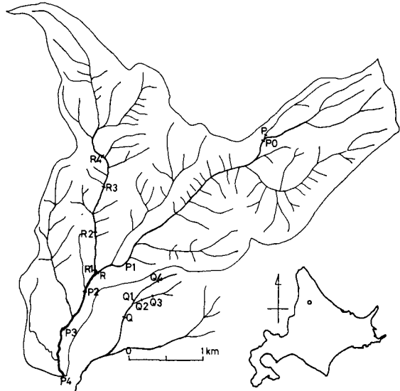
第1図 観測流域図(北海道雨竜郡幌加内町母子里, 北大・雨竜地方演習林内)。記号は水溫観測地点を示す。