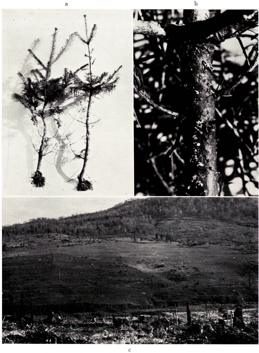
第2図 a. 大滝国有林被害地に於ける約7年生被害トド苗(縮少) b. aの苗木のがんしゅ部に見られる子のうぼん(約実物大) c. 大滝国有林内造林地被害の景観

Text-Fig. 2. a. Two attacked saplings of Todo-fir of about 7 yrs. old from the damaged area of Otaki national forest. b. Cankered surface of a stem on which numerous apothecia are seen. (Approximately natural size). c. Afforested area of Otaki national forest in Hokkaido wherein heavy damage has occurred.