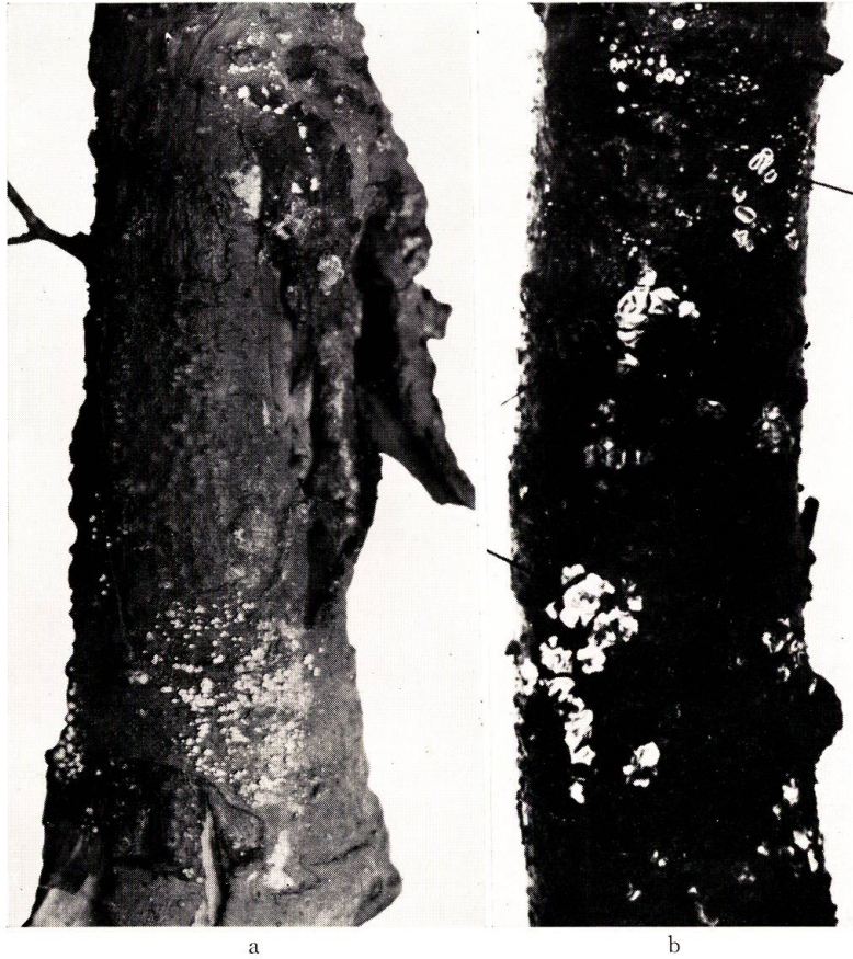
第1図 a 北大演習林苗圃内約15年の被害トドマツ 約実物大 (烈しいがんしゅ部とその上に生じた多くの子のうばんを示す) b 1927年北大農学部内水産学講堂南側約13年の被害トドマツ (成熟並に過熟の子のうばんを示す) 約実物大

に茎の表面の葉痕又は皮目を中心として、類円形の小罹病区域を生じ(第3図 a. 2), 次第に長楕円形, 不規則輪廓のやや広い範囲に拡大し行く。時として病斑と健全部との間に癒傷組織が土堤状に発達して, 陥没した病斑をとりかこみ, 或いは罹病部が周囲の健全部より遊離し, 罹病区域進展を全く終熄させ, さらに傷痕の部分完全に被覆する場合も見られるが, また病勢が盛んなときには, 病斑の周囲に生ずる2~3重の癒傷組織の上にも引きつづき子嚢盤の発生を見ることもある。かくて茎の片側の一局部になお健全組織が残っているときは, その部よりの小枝上には生葉を付けて, 苗木全体としては半枯損状を呈し居るも(第3図 a. 1) 病斑が茎を一周して環状の壊死部を生ずるときは, それより上部は枯死に