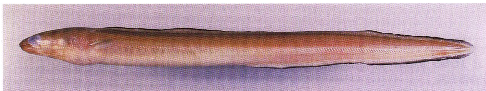
Fig. 1. Lateral view of Ariosoma meeki , HUMZ 181032, 382.6 mm TL, off of Hachinohe, the Pacific coast of Aomori Prefecture.

体は卵形で側扁する。体高は高く, 尾柄部は細い。体の輪郭は背縁および腹縁ともに弧状を呈する。体は強い櫛鱗で覆われる。眼は大きく, ほぼ完全な円形を呈する。眼の前部上方に 1 棘がある。吻は短く, 涙骨の側面に外後方へ向かう 2 叉した 1 棘がある。下顎は上顎より突出する。両顎歯は小さく, やや広い歯帯を形成する。背鰭基底は臀鰭基底より短い。胸鰭は長く, その基部は頭部のやや後下方に位置し, 後端は腹鰭基部に達する。腹鰭は長く, その後