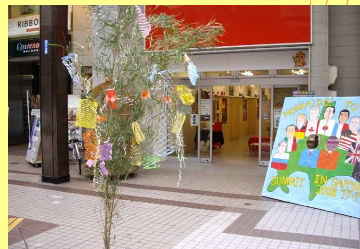
【狸小路商店街の文化体験コーナー-Wassyoi札幌】