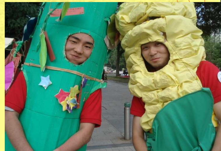
【大通で活躍した竹くんととうもろこしちゃん】