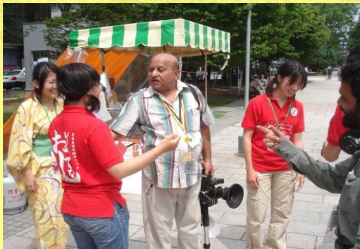
【インド人ジャーナリストと交流する様子】