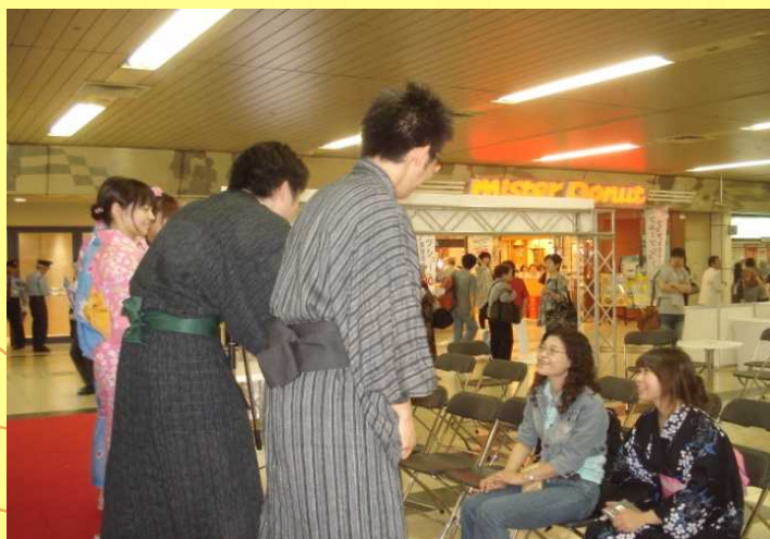
【札幌駅での日本語講座】