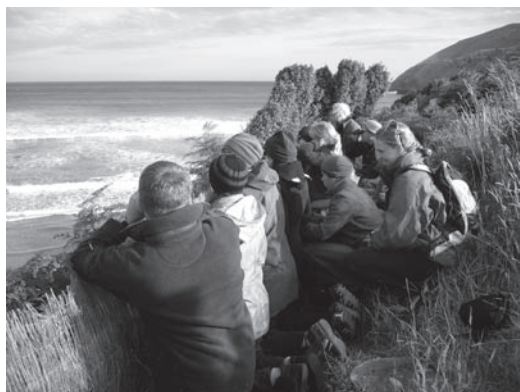
ニュージーランド・カトリンズ海岸でペンギンの上陸を観るエコツーリスト

光メニューを選んでも、地域内外の観光関係者の「力関係」が変わらない限り、今まで通り「おいしいところ」を外部にとられるだけでしょう。そして、地元への協力金の支払いなどで「正当化」され、自然環境保全だけを離島側が強いられることになりかねません。