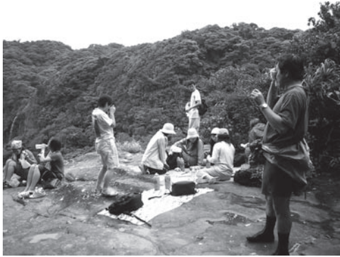
西表島船浦湾のエコツアーで休息するエコツーリスト

エ コツアーリズム。この言葉が紹介されてから15年ほどの間、観光・地域振興・自然保護にかかわる関係者はずっとこの言葉に魅了されてきました。 日本では先進地と言われている西表島や屋久島では、エコツアーリズムが「エコツアー」として現実になり、国内各地でも実践が始まっています。もはやエコツアーリズムは、離島で観光による地域振興を考える際に切り離せないマジック