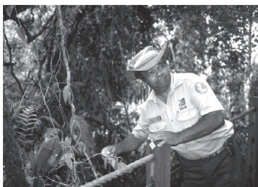
オーストラリア・ケアンズ郊外。ガイドによる熱帯雨林の解説

持続可能な観光の実現のためには、地域資源を再評価し、それを維持するための努力を私たちが忘れてはなりません。離島におけるエコツーリズムの「先進例」はそれを明示しています。