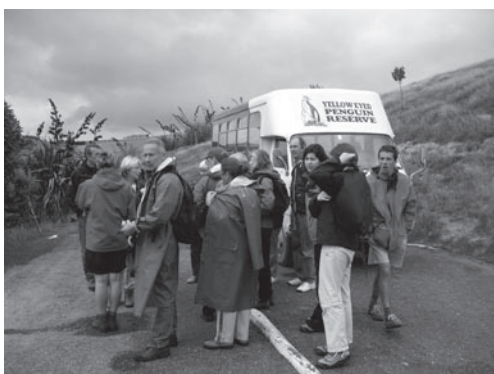
ニュージーランド・オタゴ半島でペンギンを観るツアーのエコツーリストたち

エコツアーリズムを「観光」と呼ぶと、エコツアーリズムは自然環境保全の手段だ、観光ではなく環境学習プログラムだ、と自然環境保全側から反論されることがあります。それはもつともな主張ですが、観光客が観光地に来て、そこで観光関係者が「エンターテインメント」の機会を提供している限りは、エコツアーリズムも自然環境を対象とする観光のスタイルのひとつです。 もちろん従来型の観光との違いはあります。従来型観光では地域振興と観光振興に焦点が当てられ