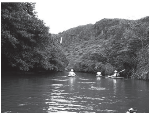
西表島船浦湾のカヤックツアー

このように従来型の観光地の離島でも、またそれ以外の離島でも、エコツーリズムは確実に広がっています。ここで重要なポイントは、エコツーリズムという、海外で生