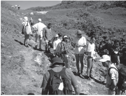
小笠原南島に上陸するエコツアー

を考えれば、離島という前提で一律に論ずることはできません。しかし、本土に比較して一般に開発圧力が弱く、豊富な自然環境が残された離島は、いわば「残された楽園」のイメージとともに、「手付かずの自然」を求めるエコツーリストにとって格好のターゲットとなつていきます。離島側にとっても、地域資源を有効活用しながら地域振興ができ、かつ環境保全可能となれば、エコツーリズムへの期待が膨らむのも無理はありません。