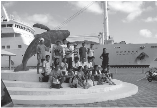
小笠原のエコツアーの「シンボル」ザトウクジラのバイオロゴをバックに

まれて日本に持ち込まれた「自然に優しい観光」というイメージのエコツーリズムが、そのまま離島で行われてはいないことです。実際には、地域文化や多様な自然環境の設定の差から、さまざまなタイプのエコツーリズムが離島では成立しています。