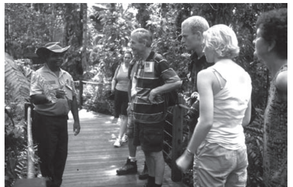
オーストラリア・ケアンズ郊外 クーランダのガイドツアー

こうした保護か利用かという二者択一の隘路に、エコツーリズムは島の自然環境の利用と保全の両立、つまり「持続可能な利用」という新たな道を示しています。そのためには、地域が自律的に地域資源を管理できなければなりません。