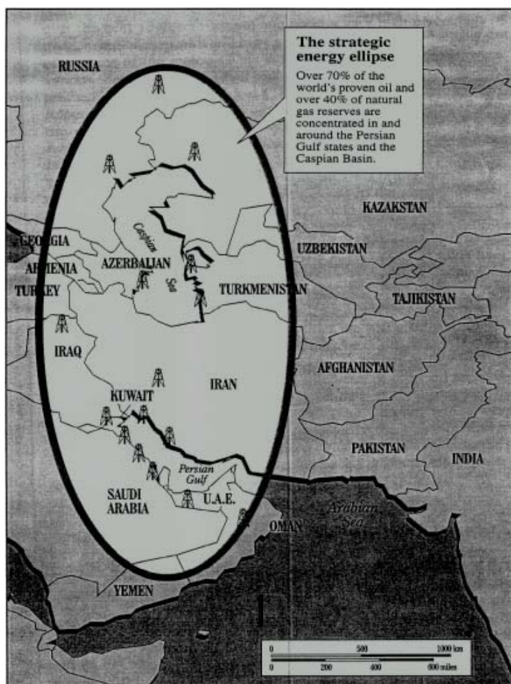
Рис. 1. Евразийский Энергетический Эллипс