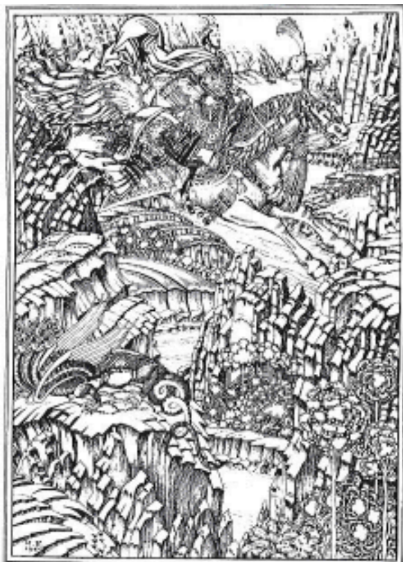
Рис. 1. Иллюстрация к былине «Дюк Степанович». Подготовительный контур. Последняя работа И.Я. Билибина. 1941.