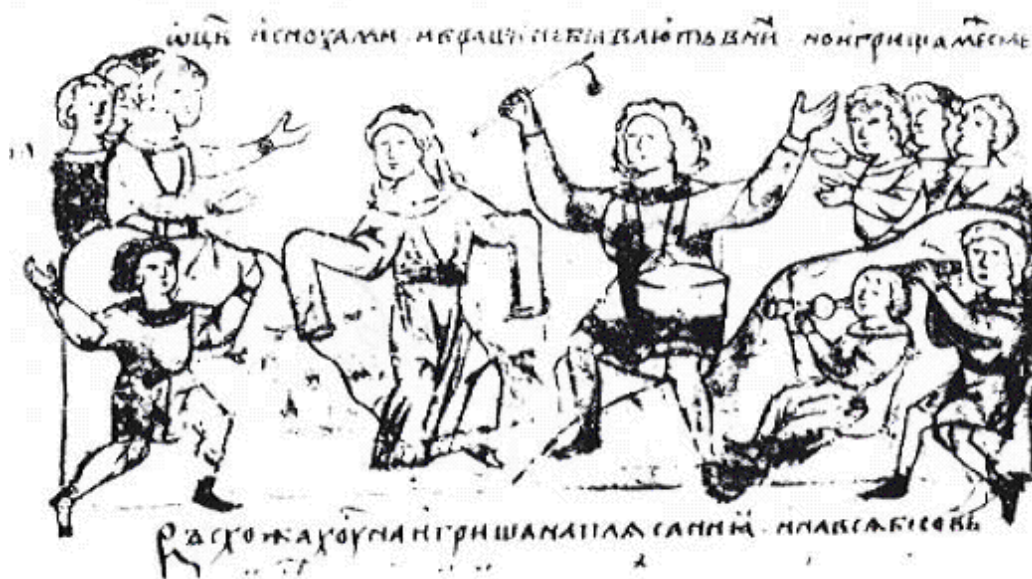
Рис. 6. «Игрища межю селы». Ритуальный танец русалий в русской деревне XI-XII вв. (миниатюра Радзивилловской летописи).

конца XVII столетия духовенство протестовало против народных игрищ. Как св. Нифонт, так и другие церковные писатели считали, что на них пляшут с бесами, и называли языческие обряды, включавшие пляски, «игрищами бесовскими», «играми идольскими», «игрищами неподобными». 58 Скоморохов считали такими же бесами, как и чудовищ: “Бес может явиться в образе зверя, змея, черного пса, медведя, волка, воина, разбойника, монаха, инородца, скомороха (курсив наш. – В.К.)”. 59 Поскольку в церковных поучениях пляска, гусли, игрище считались „злым и скверным делом”, 60 совершенно естественно, что священникам категорически запрещалось плясать и даже наблюдать пляску 61 (рис. 6).