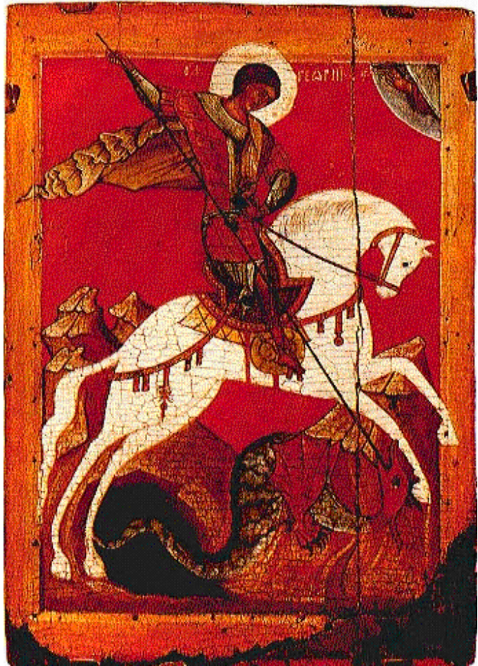
Рис. 3. Чудо Георгия о змие. Вторая половина XV в., Новгород. Дерево, яичная краска. Государственный Русский музей, С.-Петербург.

В русских духовных стихах змей – символ зла и греха. Обратимся к стиху «Плач Адама» о крещении Христа. Г. Федотов так о нем пишет: «Обновление мира крещением Христа связывается с очистительной силой водной стихии и мыслится по аналогии с крещением-таинством. В лице Христа как бы крестится, очищаясь от грехов, вся земля». И в продолжение Федотов цитирует стихи: