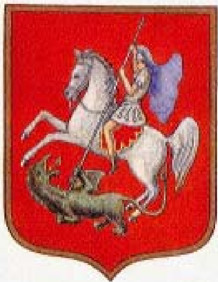
Рис. 4. Герб Москвы времени царствования Александра III. 1881-1894. Бумага, акварель. Государственный Эрмитаж, С.-Петербург.

поэт его пожалел: пожалел и пригрел. Помнит ли он, что с нечистью шутки плохи?» 46