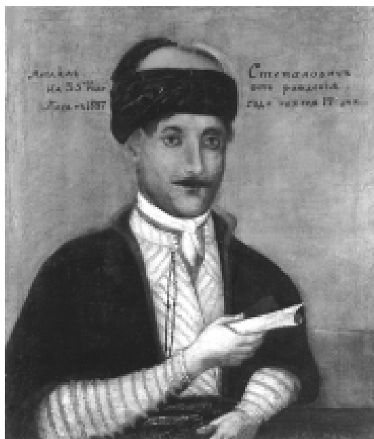
Илл. 6. Иван Степанович. Портрет Михаила Степановича. 1837. Национална художественна галерея, България.

Портрет занимает важное место в социальной жизни, поэтому можно предположить, что изображение человека соответствовало его общественному положению и было адекватно его времени. Портрет как художественная форма должен идти в ногу со временем и, отставая в развитии, он превращается в архаику, фольклор, становится, наконец, достоянием провинциальной среды, а его место занимают новые художественные формы. Множество подобных примеров мы найдем в мещанском украинском портрете работы цеховых мастеров XIX в., стилистически идентичном болгарскому портрету периода Возрождения. Уже доказано прямое влияние цеховых украинских живописцев на творчество болгарских художников XIX в. Ивана Стоянова-Степановича и Александра Попгеоргиева, которые учились на Украине (см. илл. 6, 7, ср. илл. 7 с илл. 8). Станковые портреты Михаила Степановича (1837 г.) и Ради Колесова (1862 г.) также близки украинским станковым портретам. Их живопись