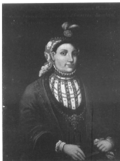
Илл. 20. Яков Сваричевский. Портрет Раины Могилянки княгини Вишневецкой. 1884. Копия с портрета конца XVI – начала XVII в. Государственный исторический музей, Киев, Украина.

бенности сохраняются вплоть до середины XIX – начала XX вв. в работах мастеров местных школ, например, на полотнах Николы Образописова (см. илл. 18).