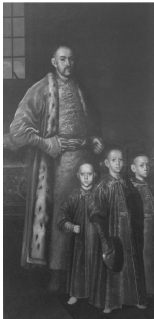
Илл. 10. Незвестный автор. Збигнев Осолинский с тремя сыновьями. 1654 (?). Музей оружия в замке, Львов, Украина.