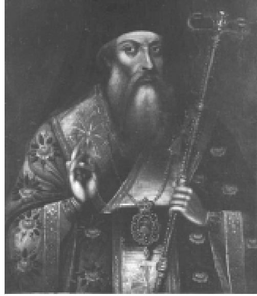
Илл. 14. Неизвестный балканский автор. Портрет епископа Софрония Врачанского, 1812. Городская галерея, Пловдив, Болгария.

мещались фигуры Христа, Богородицы или святых. Все эти композиционные особенности также связаны с культом предков и основаны на использовании средневековых иконографических схем.