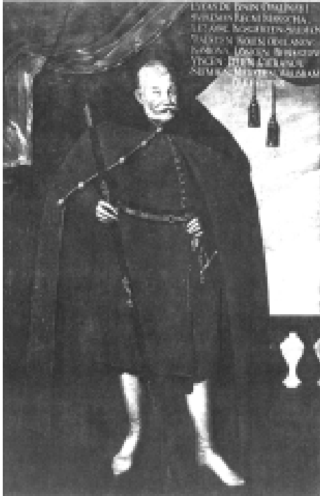
Илл. 17. Неизвестный автор. Портрет Лукаша Опалинского, ок. 1635. Фундация Чарториских Народного музея, Краков, Польша.

В Польше портрет в наибольшей степени формировался под влиянием эстетики надгробья. 24 В XV в. польское надгробье, подобно итальянскому эпохи Возрождения, трехмерное, горизонтальное. В XVI в., когда наступает контрреформация, идеи средневековья актуализируются и надгробья становятся двухмерными, приобретая сходство с рельефом 25 (см. илл. 16).