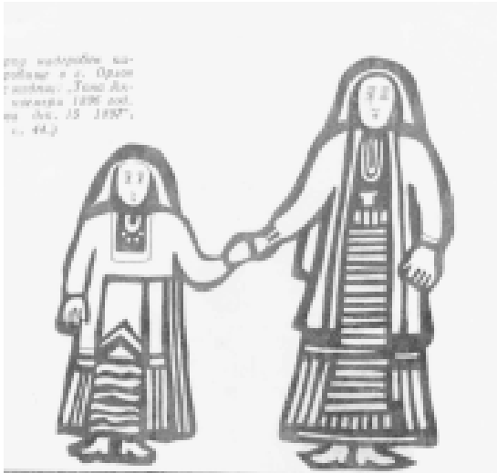
Илл. 24. Изображение на надгробном камне старого кладбища в деревне Орлов дол. 1896. Болгария.