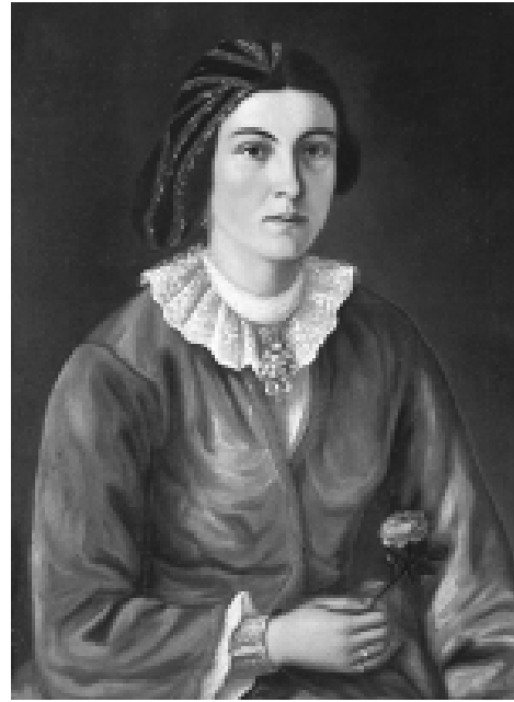
Илл. 22. Станислав Доспевски. Портрет Домники Ламбревой. 1861. Художественная галерея, Пазарджика, Болгария.

тие на столе возле ростовой фигуры в сарматском портрете и в украинских портретах духовенства – это не что иное, как уменьшенный крест; то же справедливо и относительно донаторского портрета с распятием (см. илл. 23). Присутствие распятия в качестве части убранства интерьера указывают на изменение пропорций составных частей композиции при сохранении ее общего смысла. Модификацию атрибутов мы можем обнаружить и в изображениях книг, появление которых связано с использованием знакомых композиционных формул, например, Пантократора с Евангелием.