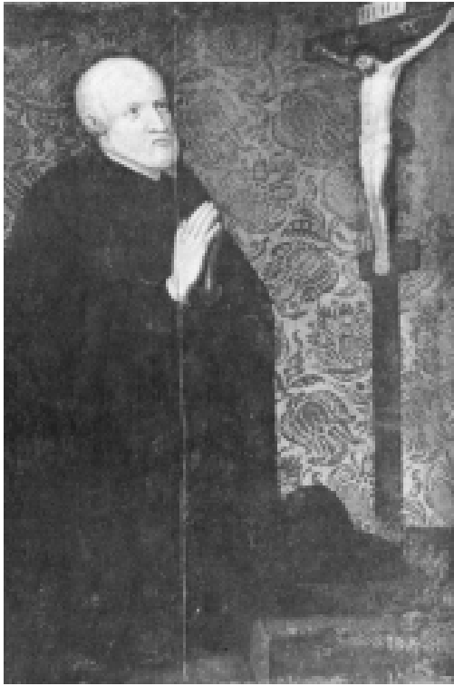
Илл. 28. Неизвестный львовский мастер. Хоругвь Константина Корнякта. 1669. Львовский исторический музей, Украина.

фиальных портретах. Эти надписи на портрете рубежа средневековья и нового времени использованы так же, как житийные тексты в средневековой религиозной композиции. Разница состоит в том, что во времена средневековья в основе религиозной композиции лежал вербальный текст, а в более поздний период портретное изображение стало ближе к изобразительному тексту, созданному предшествующей эпохой. На портрете вербальное начало вторично, и в этом его главная особенность. Вторая особенность портрета кануна нового времени состояла в том, что он мог становиться частью религиозной композиции (это характерно для украинской живописи XVIII в. и болгарской XIX-го).