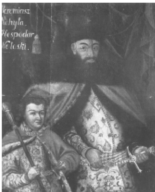
Илл. 19. Неизвестный автор. Йереми Могила с сыном, XVIII в. Государственный исторический музей, Киев, Украина.