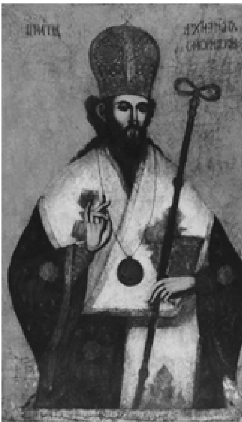
Илл. 9. Иван Николов. Портрет митрополита Игнатия I. 1829. Исторический музей, Самоков, Болгария.