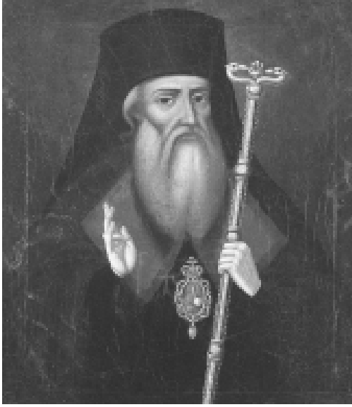
Илл. 13. Неизвестный балканский автор. Портрет епископа Софрония Врачанского. 1812. Церковный историко-археологический музей, София, Болгария.