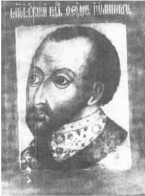
Илл. 1. Русский мастер. Портрет царя Феодора Иоанновича, 20-40 гг. XVII в. Государственный исторический музей. Москва, Россия.

продумывались заранее, о чем свидетельствует традиция вышивки на хоругви, которая, как правило, делалась, еще при жизни человека (см. ниже). Шести- или восьмиугольные надгробные портреты, получившие распространение исключительно в Польше, заказывали после кончины изображаемого на нем человека и ставили на торцевой стороне гроба. Эти портреты после похорон также помещались в родовой галерее на восточной стене церкви над надгробием, и они выполняли мемориальные функции.