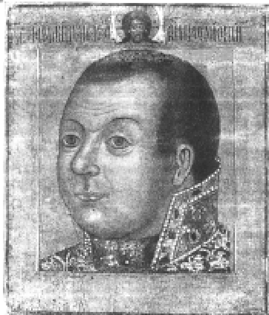
Илл. 2. Неизвестный русский автор. Портрет М.В. Скопина-Шуйского, первая половина XVII в. Государственная Третьяковская галерея. Москва, Россия.

Родовая портретная галерея формировалась в капелле. А. Глатц отмечает присутствие таких галерей в костелах Словакии с XVII-го и вплоть до XIX столетия. 9 Наряду с посмертными портретами в костеле часто ставились «фиктивные изображения» (термин А. Глатца) родственников для продолжения традиции. На этих мемориальных портретах, созданных спустя многие годы после смерти людей, которые на них запечатлены, они, как и на посмертных портретах, изображались живыми. Как полагает тот же исследователь, место портрета в родовой галерее соответствует принципу обязательного наличия фотографии основателя рода в семейном альбоме: портреты часто копировали с тем, чтобы они висели не только в костеле, но и в домах родственников. Таким образом, портрет становится носителем социального статуса рода, и элементы, отражающие социальное положение человека, занимают важное место в его композиции.