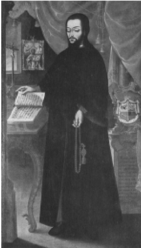
Илл. 25. Самуил. Портрет Дмитрия Долгорукого. 1769. Национальный художественный музей, Киев, Украина.

жен псалтырь, который раскрыт на седьмой кафизме 51 (см. илл. 25) – возможно, он имеет какое-то отношение к трагической судьбе бывшего князя. 52 Фрагмент текста Евангелия от Луки (12:4) 53 на уже известном нам портрете Игнатия I выступает в качестве своеобразного объяснения обстоятельств убийства мусульманами этого православного митрополита.