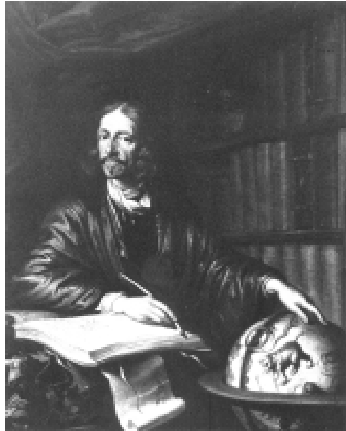
Илл. 8. Анджей Стех. Портрет Яна Хевелиуса. 1678. Библиотека Академии наук в Гданске Академии наук, Польша.