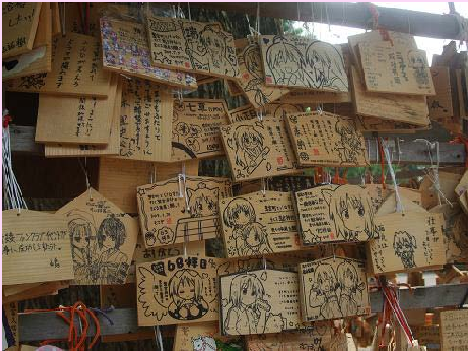
鷺宮町・鷺宮神社絵馬掛所