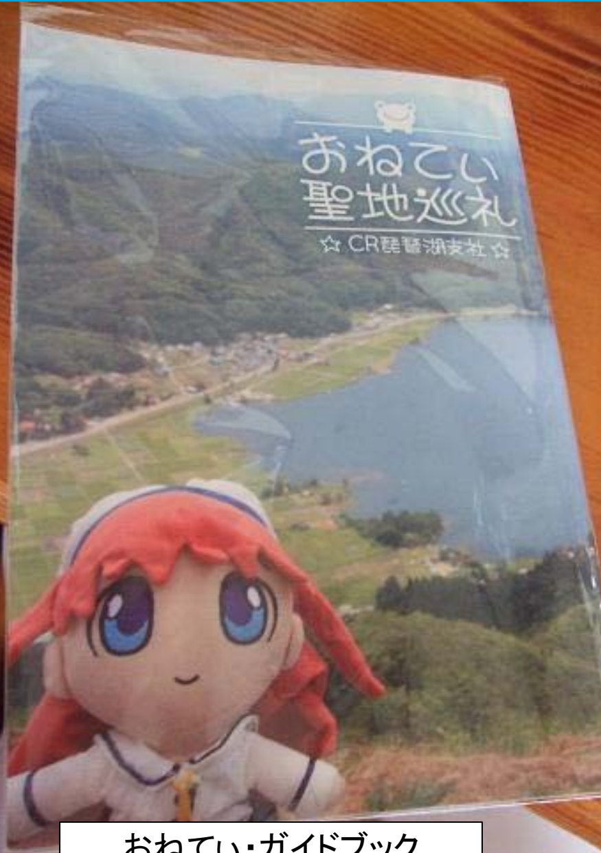
おねてい・ガイドブック