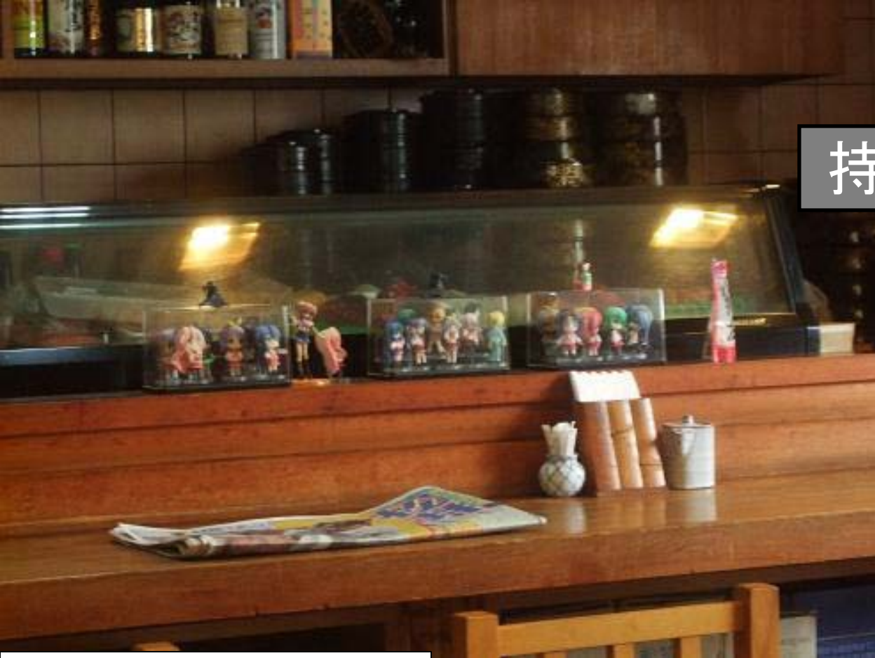
鷺宮町・寿司店カウンター