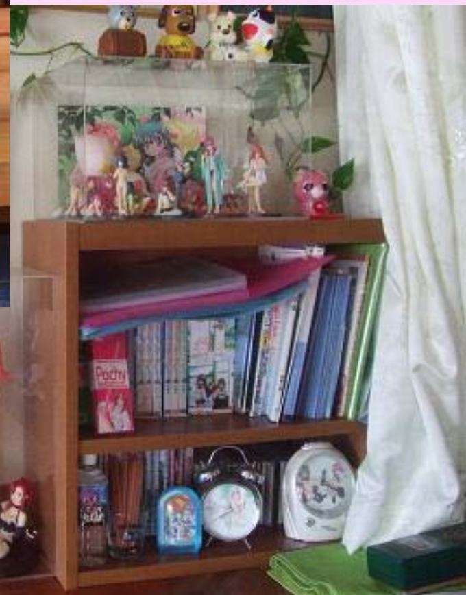
大町市・山正旅館