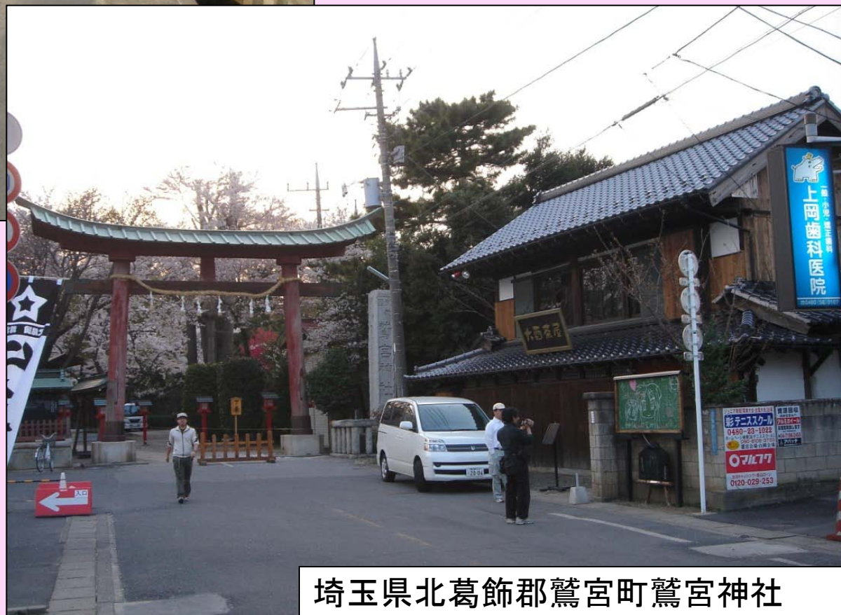
埼玉県北葛飾郡鷺宮町鷺宮神社