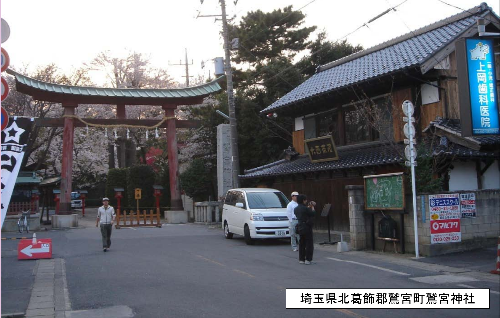
埼玉県北葛飾郡鷺宮町鷺宮神社