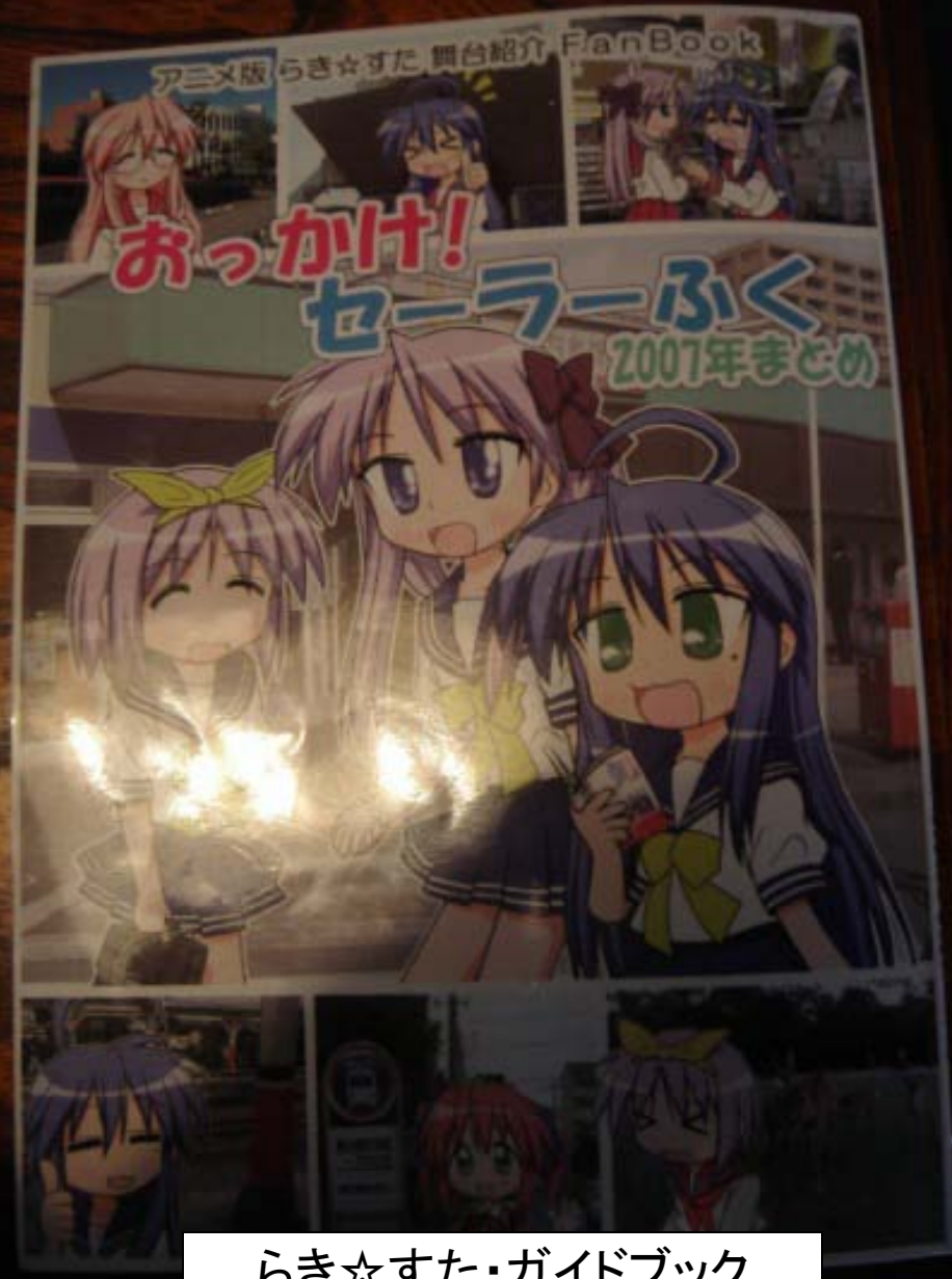
らき☆すた・ガイドブック