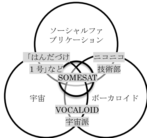
図5 SOMESAT の文脈多様性・多重性

いると考えられる。一方、宇宙やボーカロイドを動機とするメンバーにとっては、人工衛星が宇宙に打ち上がり、キャラクターがパフォーマンスを行わなければ目的は達成されない。よって、効率的に目的が達成できると期待される、制度的で中央管理的な組織を志向すると思われる。SOMESAT が自発性や流動性などを特徴とするソーシャルファブ리케이션に由来するのにもかかわらず、制度的で中央管理的な「プロジェクト」を目指していったのは、宇宙やボーカロイドといった異なる文脈と重なった所に生まれた実践だったからではないか。