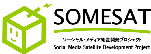
図 1 SOMESAT ロゴ (SOMESAT Wiki)

SOMESAT (図 1, 2) は、「初音ミク」 3) などのキャラクターを搭載して宇宙に打上げて社会の反応を調べ、宇宙を身近にするために開発が進められている超小型衛星およびその開発プロジェクトである (SOMESAT Wiki). ソーシャルメディアにおいては、異なるカテゴリのクリエイターたちの相互作用によってコンテンツが生成されることがある (濱崎ほか 2010). SOMESAT のプロジェクトは、ものづくりの様子を撮影した動画をニコニコ動画に投稿したり、「つくってみた」ものをオフラインの会合で披露しあったりする活動である。「ニコニコ技術部」 4) を起源とし、特定の研究機関や大学、企業などによってではなく、また学閥や仕事縁、地縁などの従来型のネットワークやコミュニティではなく、主にインターネット上で知り合った、異なるカテゴリの技術者や事務担当者たちの相互作用、つまりソーシャルメディア的な手法によって行われている。また、衛星打上げ後は、キャラクターが宇宙でパフォーマンスを行っている映像をソーシャルメディアに流すなど、ソーシャルメディアと連動した実践を行っていくことが考えられている。SOMESAT とは、ソーシャルメディアによる、ソーシャルメディアとしての衛星開発プロジェクトである。