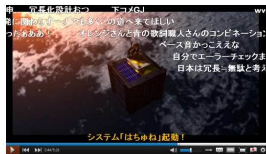
図 2 SOMESAT PV (ussy 2010) 5) に見る超小型衛星のイメージ

や電子工作の展示会などのイベントに出展したりもしている。SOMESAT では、「コアメンバーを除き、自分がメンバーだと思って活動に加わればメンバー」(SOMESAT Wiki) であるので、IRC などの場への出入りは事実上自由になっており、2009 年のプロジェクト発足当初からずっといるメンバーもいるが、メンバーは固定ではなく、常に入れ替わっている。