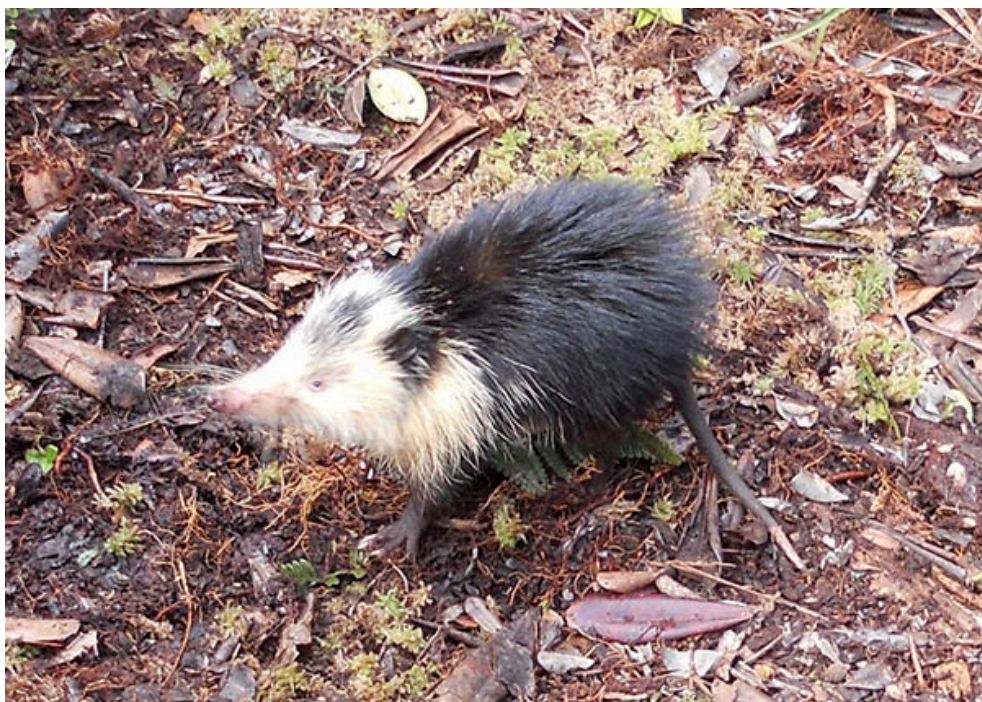
一 キューバソレノドン

キューバソレノドンは現地ではアルミキと呼ばれ、キューバの切手や記念コインになるなどキューバを象徴する希少動物です。1970年代には一度絶滅したとされていましたが、2003年に1頭が生体捕獲されました。しかしその後はまったく生息状況がわからず、まさに幻の動物でした。このため生きた個体どころか標本さえも見ることもまれな動物で、学術的な調査はほとんどなされていませんでした。