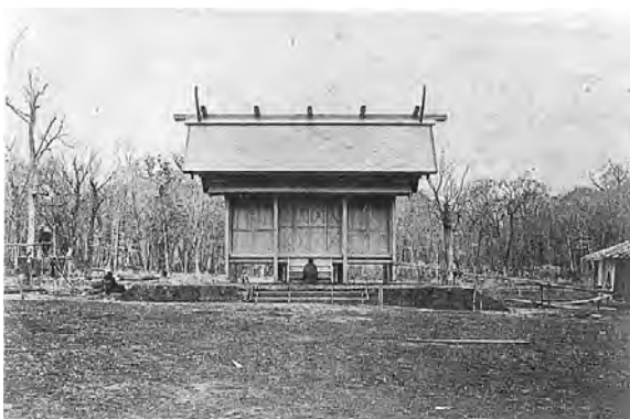
写真1 創建当時の札幌神社(正面)

開拓使は、スチルフリエートの助手として開拓使本庁写真掛の武林盛一ら3名を「写真伝習」の名目で同行させています。そのためか、スチルフリエートの撮影した写真の記録は、比較的詳細に残っています。その記録によると、スチルフリートは札幌近郊の風景・構造物のみならず勇払・白老・幌別などでアイヌの人々を撮影しています。スチルフリートは約40種類(枚数は不明)の写真を撮影したことがわかっています。このうち、北方資料室では、重複している写真を除くと、7種類・21枚の写真を所蔵しています。