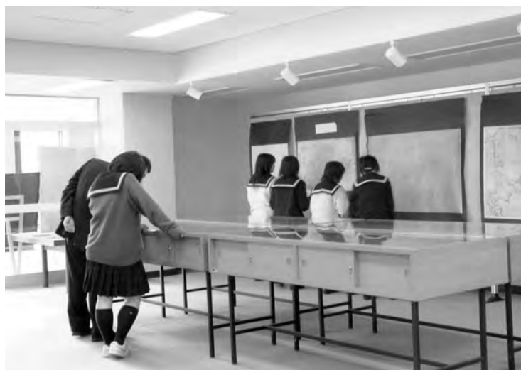
北方資料室の資料を見学する北海道八雲高等学校の生徒