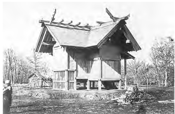
写真2 札幌神社(背面)

札幌神社は、今の北海道神宮です。写真は、明治4年円山に竣工した仮本殿で、撮影日は明治5(1872)年9月27日(太陽暦10月29日)です。