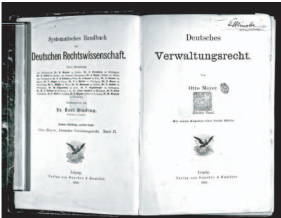
写真1 美濃部文庫 (Deutsches Verwaltungsrecht, Band 2 / Mayer, Otto. - Duncker & Humboldt, 1896) 表題紙上部に美濃部達吉のサイン, 中央に蔵書印が見える。

『美濃部文庫』という言葉が出てきました。これが書庫の中で見つけた美濃部達吉の蔵書のことです。補足すると, 北海道大学は, 札幌農學校・東北帝國大學農科大學・北海道帝國大學から北海道大学へと移り変わってきました。札幌農學校・東北帝國大學農科大學の時代は, 農学部のみ为学校でしたが, 北海道帝國大學の時代になり, 医学部 (1919年), 工学部 (1924年), 理学部 (1930年)と農学部