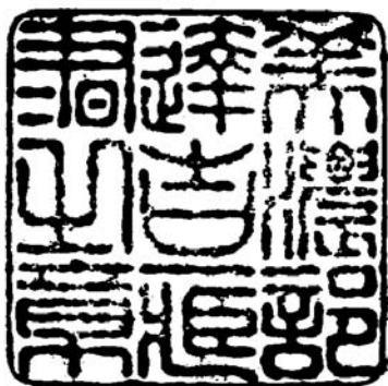
写真3 蔵書印の拡大。 『美濃部達吉蔵書之章』と読めます。