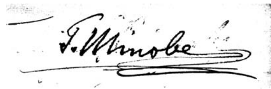
写真2 サインの拡大。『T. Minobe』