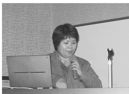
綾田北大大学院医学研究科・ 医学部図書閲覧係員