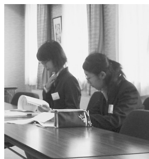
図書館の概要について聞き入る武蔵女子短大(左)と藤女子大(右)の実習生たち