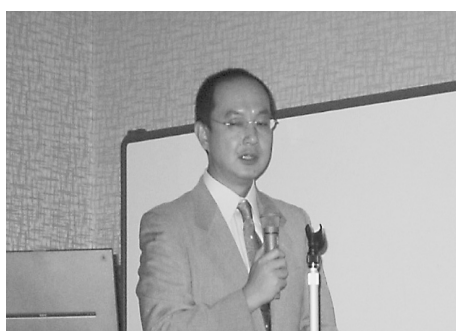
竹鼻北大附属図書館 情報サービス課参考調査係長