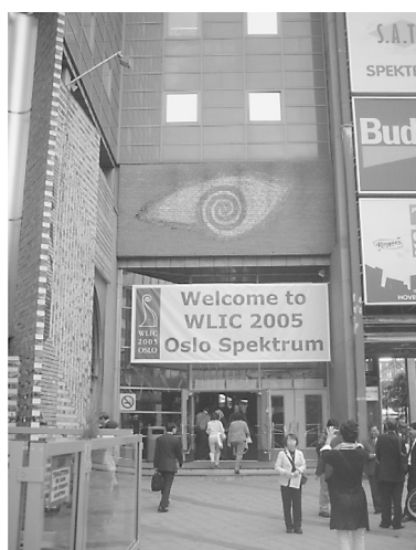
会場(オスロ・スペクトラム)

平成17年8月14日(日)から18日(木)にかけてオスロ市(ノルウェー)で開催された第71回国際図書館連盟(IFLA)年次総会に参加しました。同大会には世界中から4000名を超える図書館関係者が集まり、様々な情報、意見交換が活発に行われました。