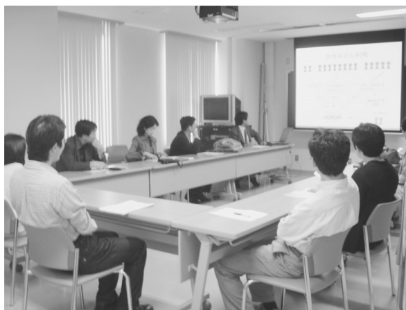
人文・社会科学総合教育研究棟 (W棟)

平成17年8月から9月にかけて、学内11部局においてHUSCAPの概要をご紹介する説明会を開催し、145名の教職員の方々に来場いただきました。説明会でお寄せいただいたご質問等について以下に紹介します。また、同様な説明会開催の希望がありましたら、学部、専攻、研究室等のような単位でも結構ですので、附属図書館 (repo@lib.hokudai.ac.jp) へご連絡ください。