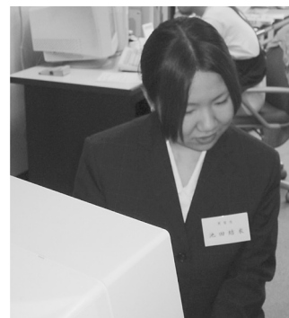
蔵書検索を行なう実習生

実習を通して、大学図書館について学べたことはもちろんですが、それだけではなく図書館員として働くことがどういうことなのかということも、断片的にはありますが知ることができました。この図書館情報学実習での経験を今後の大学での勉強や、さらにこの先就職してからも、活かしていきたいと思っています。