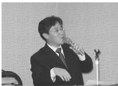
南国立国会図書館調査及び 立法考査局文教科学技術課主査