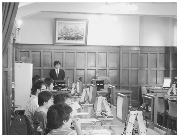
理学研究科・理学部