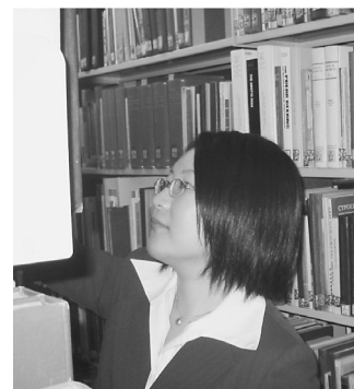
書架点検を行なう実習生

この実習は，これから始まる就職活動や，それから先の将来にも活かすことのできる，活かさなければならぬ，自分にとって本当に実りあるものであった，と心からそう思っています。