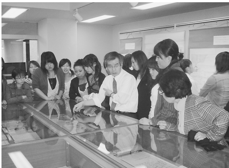
北方資料室を見学する北海道ハイテクノロジー専門学校生