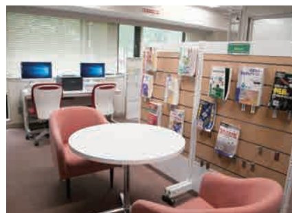
新着図書/雑誌コーナー

図書室に入るとすぐそこは、新着図書/雑誌コーナーになっています。テーブルとイスもあり、こちらで閲覧可能です。イスの座り心地もとても良いですよ。また、PCもそばにあるので、気になったことをすぐに調べられます。新着コーナーの資料は順次入れ替わりますので、ぜひチェックしてみてくださいね。