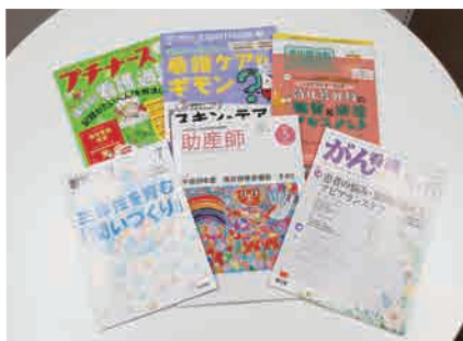
看護系雑誌だけでも種類豊富(写真は一部)

まさに本学の基本理念の一つ、「実学の重視」を体現している保健科学研究院。その教育・研究活動を支援するため、図書室では、各専攻に関する医療系の資料を幅広く収集しています。特に医療従事者向けの雑誌が揃っているので、学外の医療職の方もよく利用に訪れます。その道のプロも頼りにする雑誌、一度触れてみてはいかがでしょうか。視聴覚資料もありますよ。