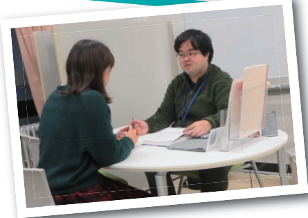
先輩(大学院生)に相談できます