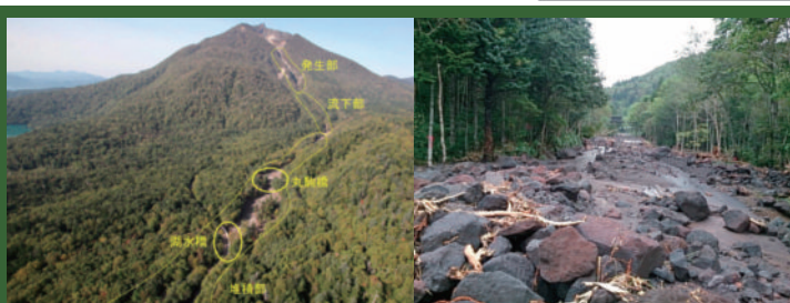
平成26年9月11日 国道453号を襲った大規模土石流(恵庭岳)