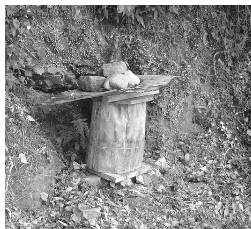
図 2. 調査地におけるゴーラ設置例

集した。その上で、養蜂の現状について地域（集落）間比較を行い、養蜂が受け継がれるための社会的特性を考察した。