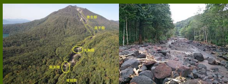
平成26年9月11日 国道453号を襲った大規模土石流(恵庭岳)