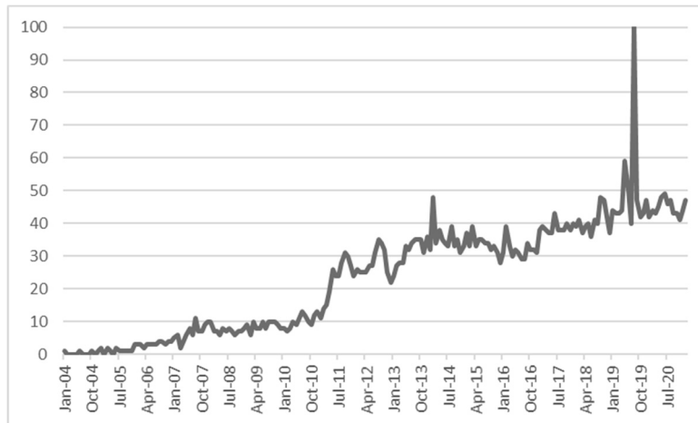
Figure.1 日本における2004年1月以降の「メンヘラ」の人気度の推移 (2021年1月27日 Google Trendsより)

以下に示すグラフ（Figure.1）は、Google社が提供するサービスである、Google Trendsにおける日本での「メンヘラ」の人気度 8 の推移を表したもの（2020年1月27日現在） 9 である。