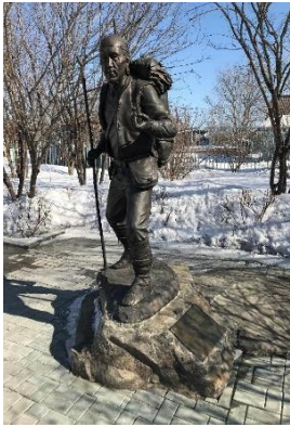
<デルス・ウザーラ像>