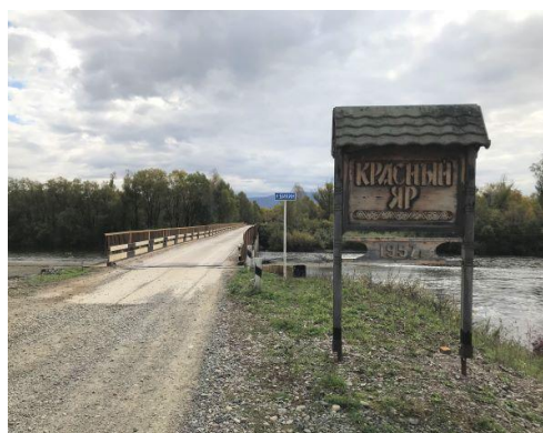
<クラスヌィヤールの入口の標識>

現在、車でクラスヌィヤールに入村する時にはまずビキン川を渡る。橋を渡ると、右手に観光客用ハイキングコース「ウデへ狩人の道」が設定されている。さらに行くと、村の中心道のレーニン通りは左に反れて小川を渡る。渡って左にある2階建の木造の建物がウデへ民族文化センターだ。このセンターはウデへ文化の博物館であり、また文化普及の拠点、そして簡易宿泊所となっている。さらに行くと右手にクラスヌィヤールの村役場がある。そのさらに奥の山側に小学校が見えてくる。