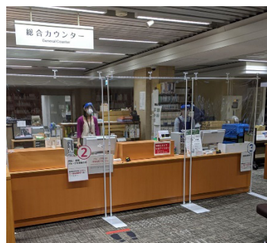
カウンター前のビニール仕切り(本館)

館内設備の消毒はこまめに行い、自動貸出機でも距離をおいて並ぶよう表示を行うなど、感染拡大を防ぐ方策をとっている。