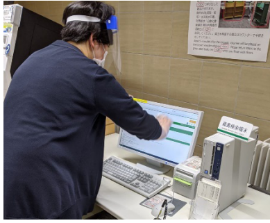
アルコール消毒作業（本館）