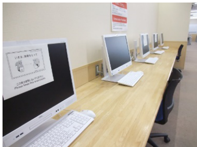
PCもソーシャルディスタンス（北図書館）