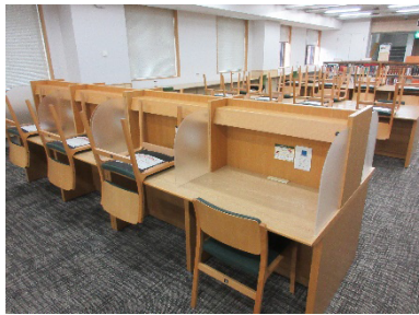
4人掛けの席は1人用に（本館）