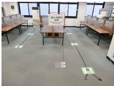
ソーシャルディスタンスの表示（北図書館）