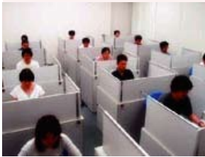
CERSS の集団実験室： 16 のパーティションつきデスクが 設置され、他者の存在を意識しつづ 行う集団内行動の実験に用いる。

さて、現在の共同研究のテーマでもあり、また私自身の研究テーマでもある「心の社会性」について、私自身、あるいは私たちの研究グループがどんな研究をしているのかを、少しばかり紹介させていただきます。