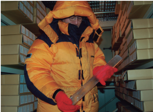
図 1. 南極で掘削された氷試料（低温研の -50^{\circ}\text{C} 低温室にて）