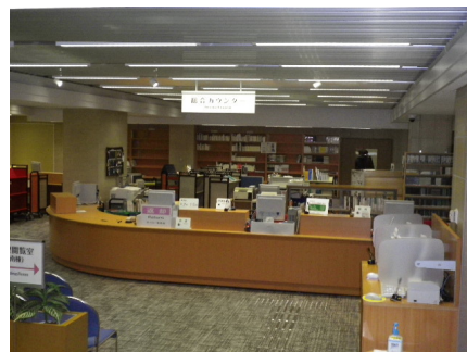
新装なった本館総合カウンター

◎：9:00-22:00 ●：本館 9:00-22:00、北図書館 9:00-17:00 ○：9:30-19:00 x：休館(年末年始 12/28-1/3、センター試験 1/14-15)