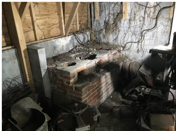
【写真6】首里劇場の炊事場 （2022年7月20日、筆者撮影）