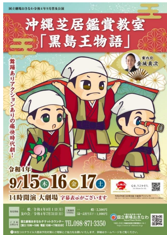
【写真13】普及公演「沖縄芝居鑑賞教室」 公演パンフレット

このほか、過去の普及公演では沖縄芝居に限らず嘉数道彦作「組踊版スイミー」など、親しみやすさを重視した演目が多数上演されてきた。「組踊版スイミー」の作者・