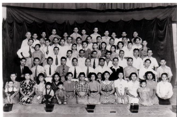
【写真7】大伸座、寿座、松劇団による 合同公演（1952年）