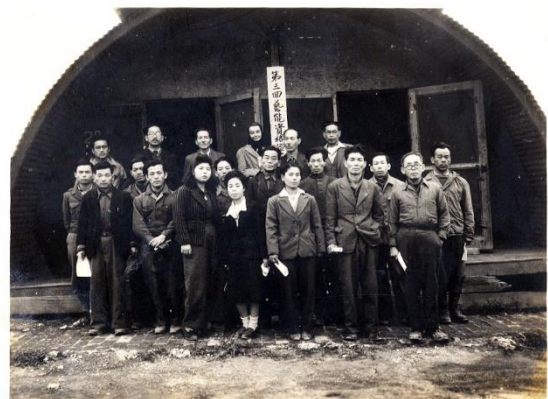
【写真4】芸能者資格審査に合格した役者（1947年）