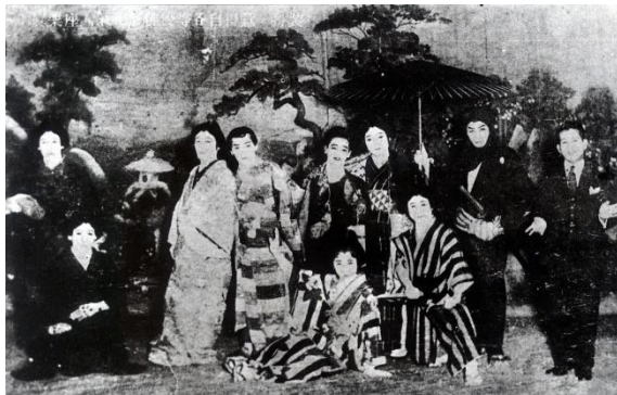
【写真2】戦前期の劇団・真楽座

1937（昭和12）年に開戦した日中戦争に伴い展開された「国民精神総動員運動」の一環で、沖縄県学務部は1940（昭和15）年に「標準語励行大運動」を推進した（沖縄県平和祈念資料館2017:23）。それまでの風俗改良や同化政策によって多くの制限がかけられてきた