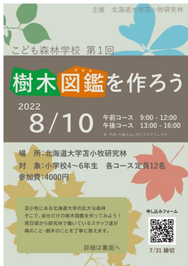
図 1. 小学校に配布した宣伝チラシ

ように比較的コアな客層を対象とした企画ではその分だけ宣伝する範囲を広く取る必要があったと考えられる。一方で、参加者は少数だったものの、こちらの想定通り自然科学に興味のある参加者が集まっており、参加者の反応を見ても満足度は高いように感じた。そのため、宣伝内容やコンテンツの構成自体はある程度の射を射ていたと考えられる。