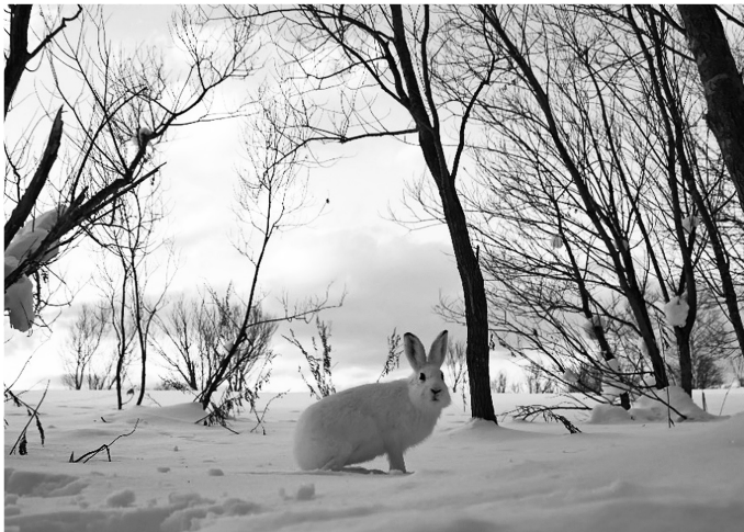
図3 エゾユキウサギ (A3)