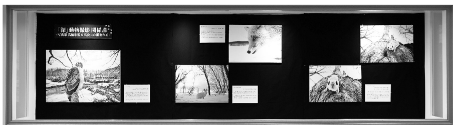
図14 完成図（壁面ケース）