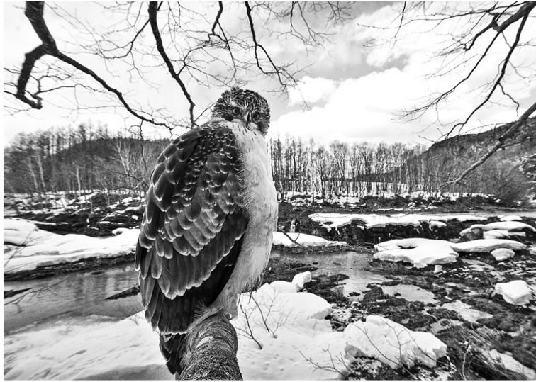
図2 クマタカ (A2)