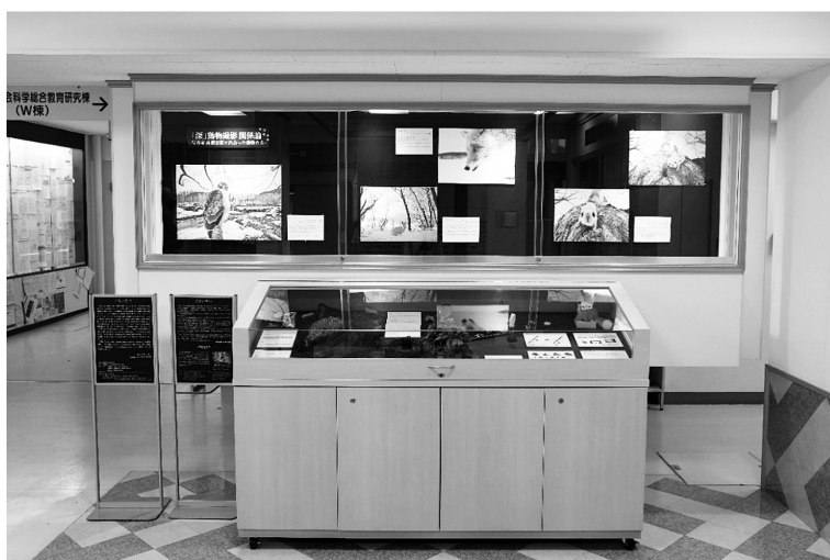
図 13 完成図 (全体)