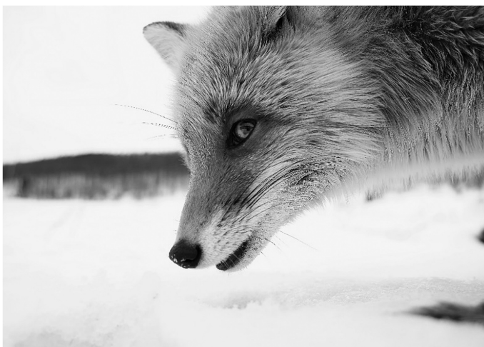
図4 キタキツネ (A3)