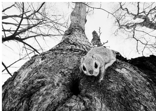
図5 (左), 図6 (右) エゾモモンガ (A3) *別個体2点

本展示のタイトルに関しては、サブタイトルを「高橋忠照と出会った動物たち」から、「写真家 高橋忠照と出会った動物たち」に変更することをメンバーに提案した。「写真家」を付け加えた理由は、高橋氏のことを知らない人が本展示のタイトルを見た際に、高橋氏が写真家であることを直ぐに認識できるようにするためであった。また、筆者の家族にポスターのデザインを見せた際、本展示が一体何の展示なのかわかりにくいという指摘を得た。本展示は、高橋氏が撮影した写真がメインであるものの、一般的な写真展のような、多数の作品を展示するものではなかった。そのため、はたして本展示を写真展と呼べるに値するほどの展示であるのかどうかを吟味することになった。そこで、本展示のタイトルに、はっきりと「写真展」という言葉を入れるべきか、あるいは鑑賞者がポスターを見た際や展示会場に来た際に、本展示のメインが写真(=作品)であることを伝えつつも、高橋氏と動物との関係性を表現するという点で、一般的に見られるような写真だけを展示する「写真展」とは区別するべきかを考えた。メンバー