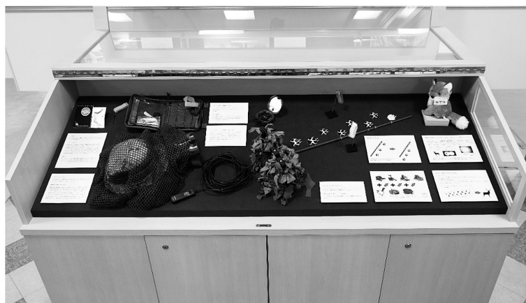
図15 完成図（斜めケース）