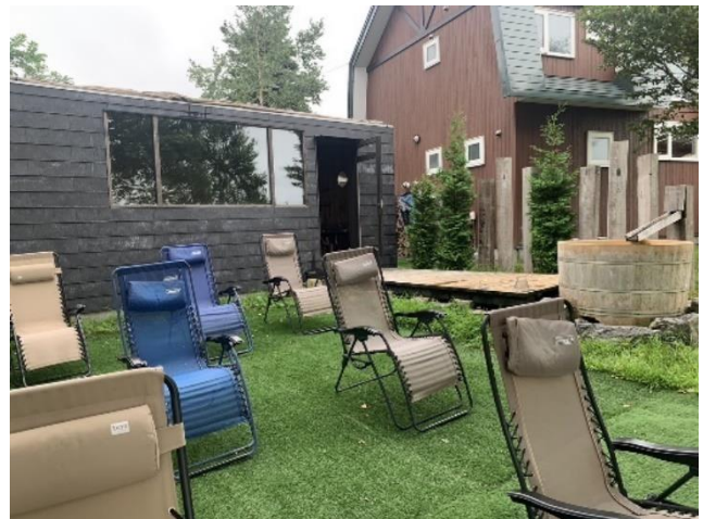
写真 2 外気浴スペースから見たサウナの外観 (2023年8月18日)