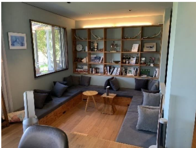
写真 1 テーブルから見たラウンジの風景 (2023年8月18日筆者撮影)