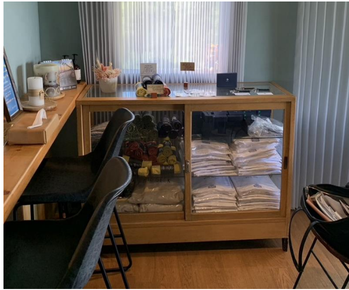
写真 4 THE GEEK の商品棚(2023 年 8 月 18 日)