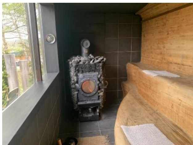
写真3 THE GEEK の薪ストーブ(2023年8月18日)