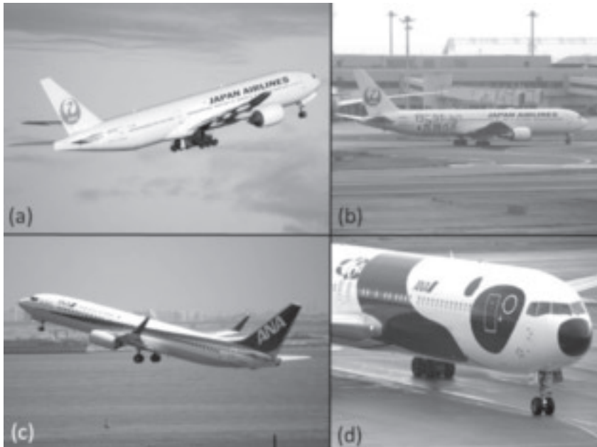
図 11.1 (a) スタンダードな〈鶴丸〉デザインの JAL 機, (b) 〈行こう!九州へ〉キャンペーンの塗装が施された JAL 機, (c) ‘Inspiration of Japan’ のタグラインが記された ANA 機, (d) ANA の特別塗装機〈FLY! パンダ〉。