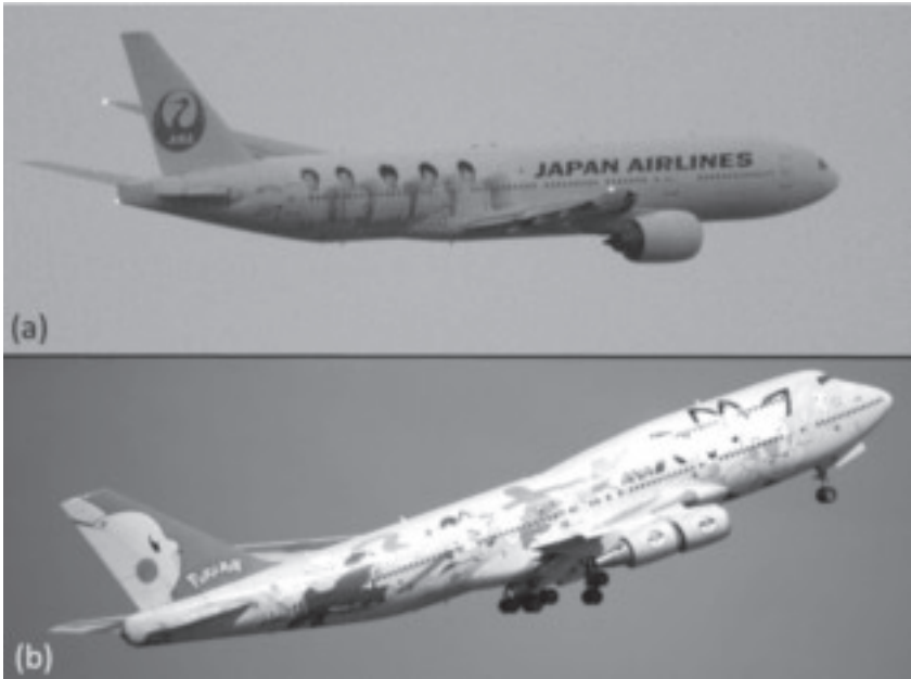
図 11.3 (a) アイドルグループ・嵐の塗装が施された JAL 機, (b) ANA のポケモンジェットの一機〈ピカチュウジャンボ〉