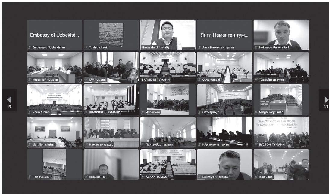
図2 国際会議の様子（ZOOM画面の1枚目）

本国際会議は、事業のカウンターパート組織であるHIRKMの他、協力機関であるウズベキスタンの雇用貧困削減省マハッラバイ起業家支援庁、ウズベキスタン共和国大統領直属行政アカデミー、駐日ウズベキスタン共和国大使館との共催のイベントとして開催された。ウズベキスタンにおいては、フェルガナ州、アンディジャン州、ナマンガン州の各マハッラにおけるヨルンダンチシ（マハッラバイ政策のアドバイザー）が区役所に集合し、それぞれの区役所単