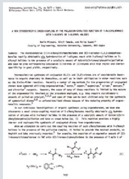
1979年に発表された論文