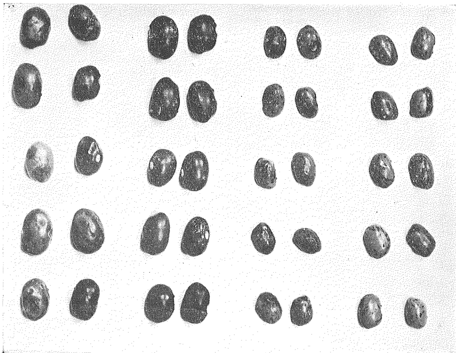
左より 本金時の罹病種子, 本金時の健全種子, ピルマの罹病種子, ピルマの健全種子

激しく罹病せるこれらの種子は發芽すると先ずその子葉に發病するが、この子葉は間もなく脱落する。その後の病勢の推移を見るに、子葉の病斑に膚接して子葉の莖との附着部に病斑を生ぜるものは、ピルマ、本金時に各々 1 個体のみで、この表によつて明かなる如く、多くは Hypocotyl の地際部にのみ發病し、Epicotyl 或は葉にも發病するものは極めて僅少である。これは子葉上の病斑に形成された炭疽病菌の胞子が撒水時の水滴によつて流下し、地際部の濕潤な状態下に於て發芽し Hypocotyl に侵入するものと想像される。尙この實驗に於て炭疽病のために枯死せるものが、ピルマ及び本金時に各々 1 個体生じた。