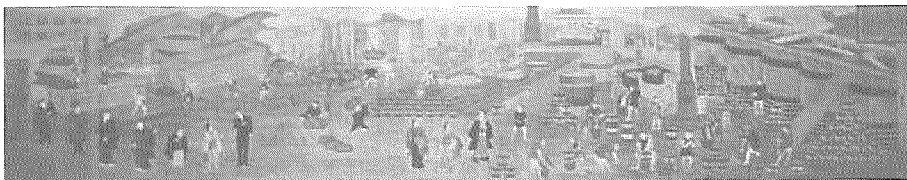
図4：4代勝文斎作 押絵扁額「野田醤油醸造之圖」[1877] 野田市郷土博物館蔵

18-19世紀前半の庶民生活を記した『守貞謾稿』においては、「特に食類に至りては、衣服等と異にして、貴賤貧富の差別なきがごとし」(p.208)との記述とともに、18世紀以前には見られ