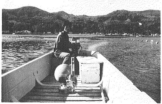
Fig. 6. An OBS scale model on a boat, which is to be launched.