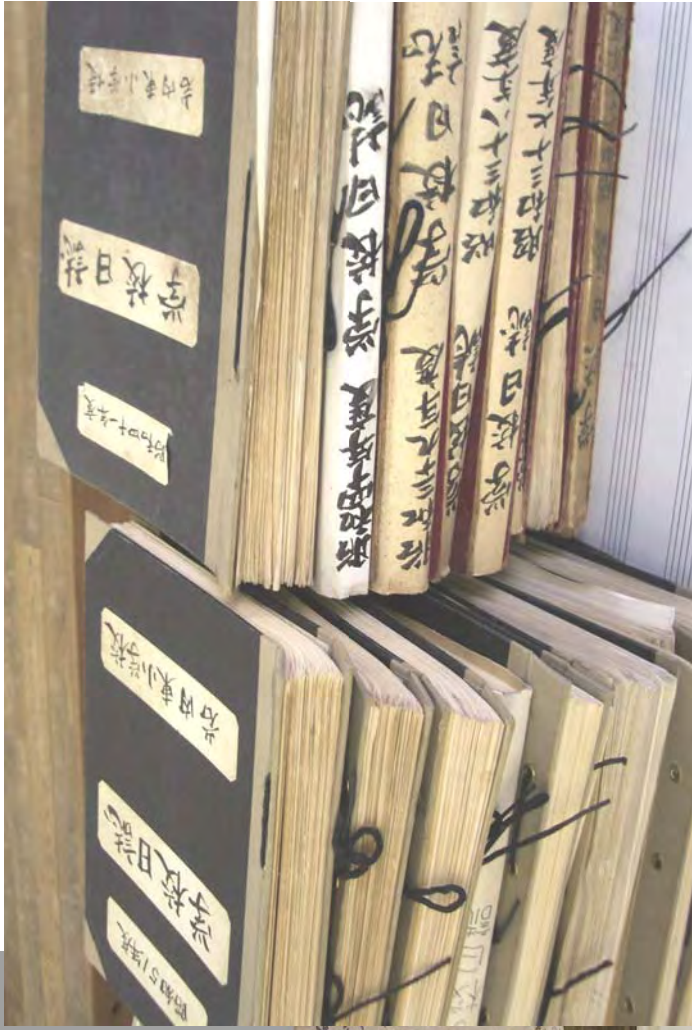
▲ 岩内東小学校所蔵資料