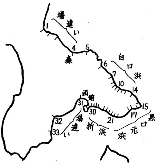
第1図 マコンブの生産地帯

を求めることによつて、昆布の品質の概要を数量的に把握することが可能である。第1表に掲げたものは総て1等級のものである。2, 3, 4等級のものは1等の0.8, 0.6, 0.4を乗じた価格で示され、長切は元揃の0.8掛、沖昆布は岸昆布の0.95掛である。品質の地域差の著しいマコンブの場合は特にそれを示す為に第1図にマコンブ地帯の地図を附した。図上の地名番号は第1表の番号と対応させてある。最良のマコンブを得られるのは川汲、尾札部であつて、この地点より隔るにつれて品質が下る。大船、木直間は最も優れたマコンブ地帯でこの昆布を加工した場合白色に出来上るので白口浜と称せられ、昆布は元揃に結束される。恵山(或いは鍛法華)から函館までは黒口浜と称せられるが、汐首を境として恵山寄りのものは元揃に結束されるのでこの地帯は元浜、函館よりのものは折昆布に結束されるので折浜と称される。鹿