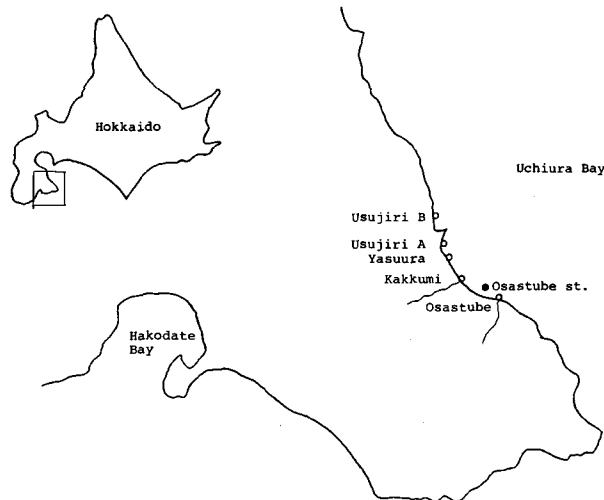
Fig. 1. Sampling station.

1986年10月21日、北海道南茅部町A採苗場において種苗の芽落ちが発生したマコンブ種苗培養水槽から種苗糸および同培養水槽水試料を採取した。また、同年10月24日、11月18日、12月16日に図1に示す地点での次の試料を採取した。すなわち、尾札部定点(母藻用禁漁区)においては表面海水、底砂、天然コンブ葉体を採取し、尾札部川河口、川汲川河口、安浦沿岸、白尻A、B地点沿岸の5地点では沿岸海水および流れ藻(コンブ)を採取した。