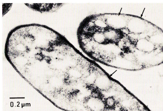
Fig. 3. Electron micrograph showing low electron dense granules (PHB, arrows) in the cells of P. marina M-5-l.

A: isolated strains (16 strains), B: Arthrobacter marinus , * 1 variable, * 2 short rods, * 3 mono polar, * 4 oxidative.