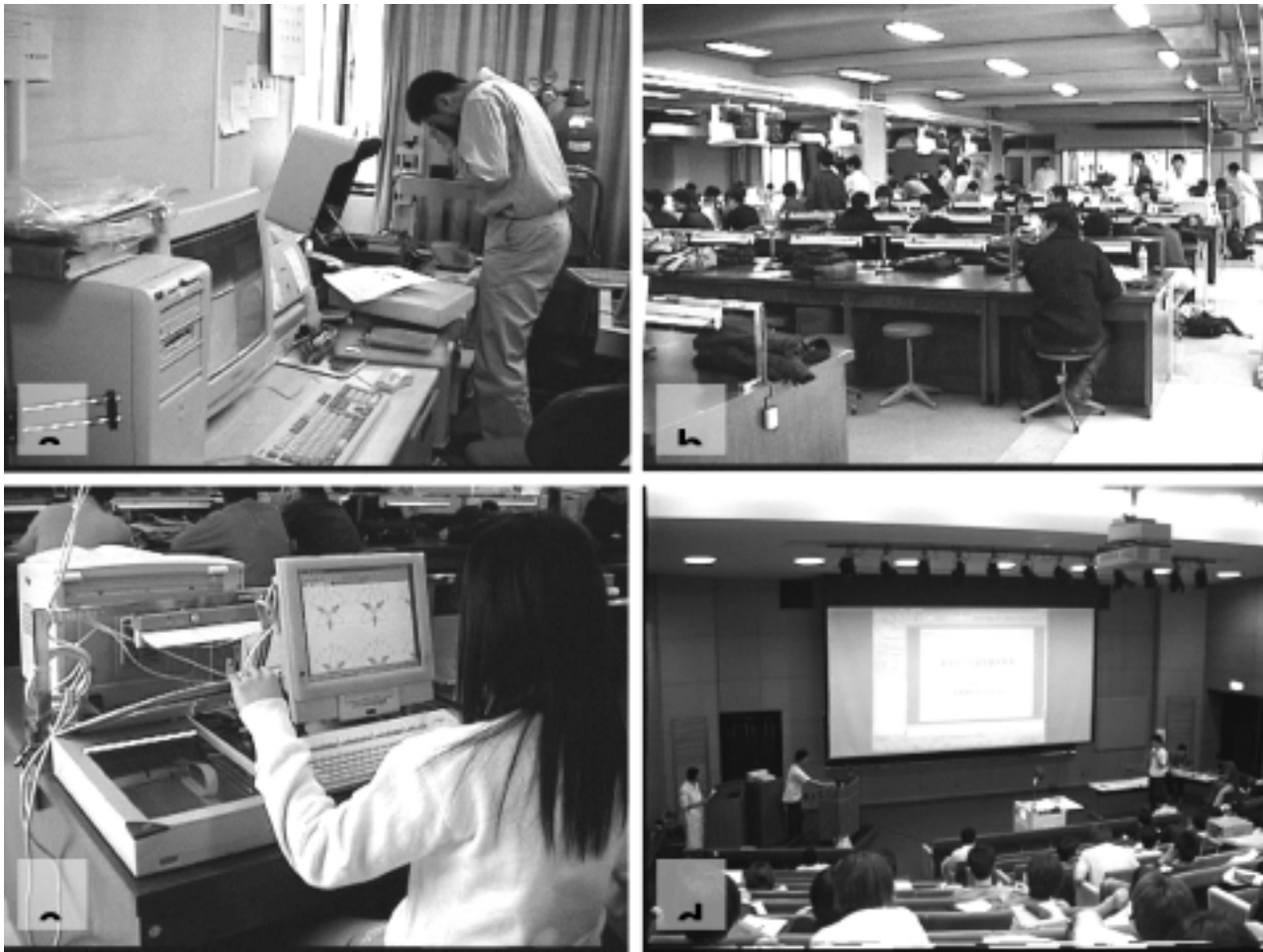
図1. 授業風景 a. 研究室取材 b. グループ討論 c. ホームページ資料作成 d. 発表