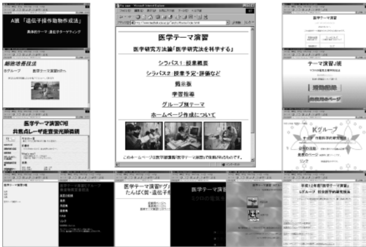
図3. 授業用ホームページ(中央)と学生各グループのホームページ

んで理解した内容をコンピュータで作図するように指導した。また、研究体験によって、自分たちのデータをもち、これを示すことになれば、オンラインコンテンツは自ずと独自のものとなる。