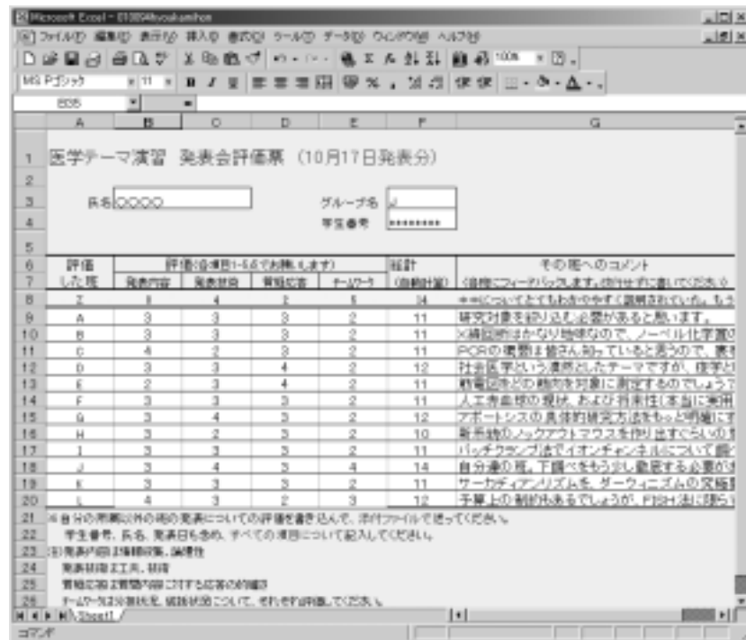
図4. 評価表 (表計算定型フォーム)

文献検索, また, 実際の研究体験等にあてられ, また各グループによっても, 個人ごとに異なる行動をとることになる。したがって, 演習への参加(出席)のチェックは, 時間を決め対面によりチェックする従来のスタイルでは困難であった。そこで, 担当教員宛に当日の行動記録を記した電子メールを送信し, 担当教員がこのメールを確認することで, 出席をチェックすることとした。原則として, 授業当日中に発信されたメールのみ受け付けることとした。