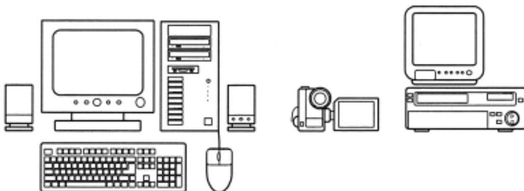
図 1 使用デジタルビデオ編集システムのハードウェア構成 編集用パソコンシステム、デジタルビデオカメラ、S-VHS ビデオデッキとテレビモニタ

ビデオカメラで使われるテープには様々な規格がある。これから撮影 ( 取材 ) をして素材を用意するのであれば、デジタルビデオ ( DV ) 形式のビデオカメラを使用するほうが、パソコンに取り込みやすくなる。