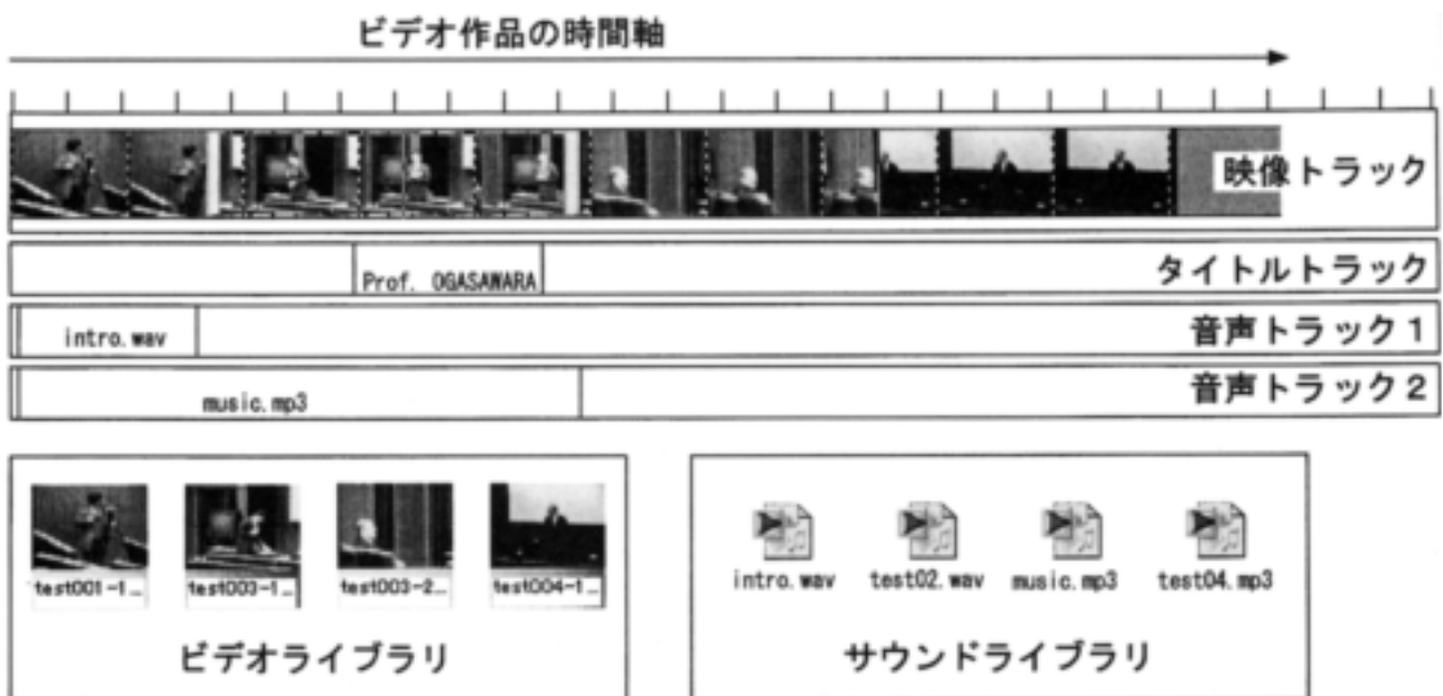
図3. タイムラインとノンリニアビデオ編集 各ライブラリにあるファイルを、タイムラインに挿入(追加)して編集をすすめる。

カット編集によって、シーンの継ぎ目がいくつができる。この継ぎ目では、映像よりも音声の整合性に注意すべきである。また、シーンとシーンの継ぎ目に特殊な効果を加えることができる。これを「トランジション」という。よく知られているのは、「ワイプアウト・ワイプイン」、「フェードアウト・フェードイン」といった効果である。編集ソフトに用意されたメニューには、覚えきれないほどの効果が用意されている。この多彩な効果が用意されている点が、デジタ