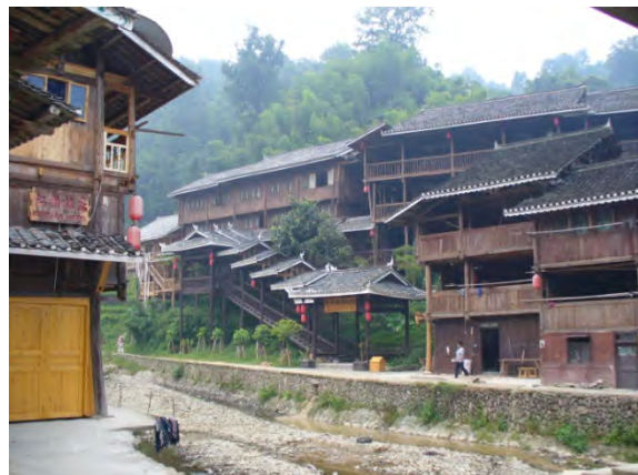
漢族資本によるホテル肇興賓館