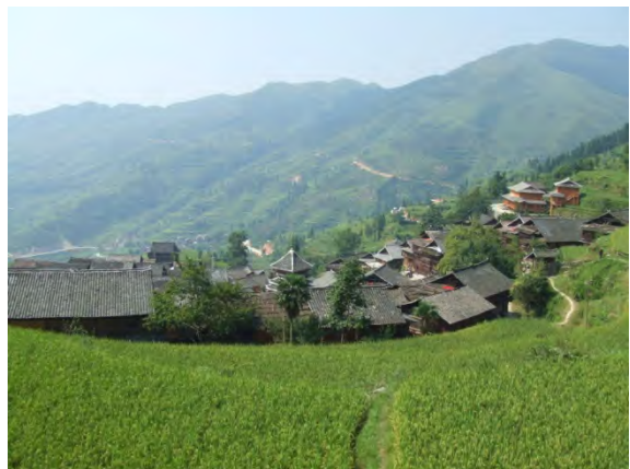
堂安村を望む風景