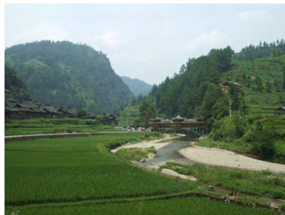
棚田に囲まれた郎徳上寨村の風景