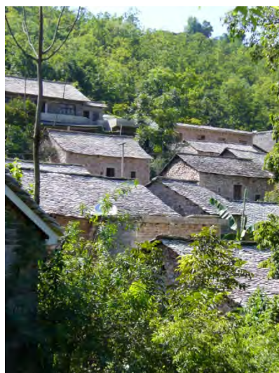
プイ族の村・石頭寨（滑石哨）

紅楓湖の民族村は、行政の建設局が中心になって、もともとダム湖があったところをレジャー開発したものです。ダム湖の周りに別荘地があって、名前が知られてきたので、それに乗じて整備をしたという経緯で、建設局としても現金収入が得られるということで整備されている場所です。ここではいろいろな民族が働いていましたが、建築などはほとんど鉄筋コンクリートで、ホンモノではない典型的な例でした。