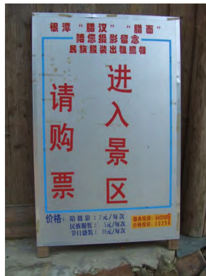
銀潭村の観光料金徴収を示す看板

緒川：あそこの村では、一応、写真1点あたりの値段が書いてありましたね。盛装10元、民族衣装5元、平服2元というように。