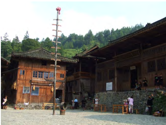
ショーを行う郎徳上寨村の広場

翌日は、西江というミャオ族の千戸集落に行きました。まとまった話は聞けませんが、観光客が数多く集まる古典的な観光地になっていました。中心街に沿って観光客目当ての店やゲストハウスが整備されていました。西江は、道の行き止まりに位置していますが、規模が大きな村ということもあって、外国人の