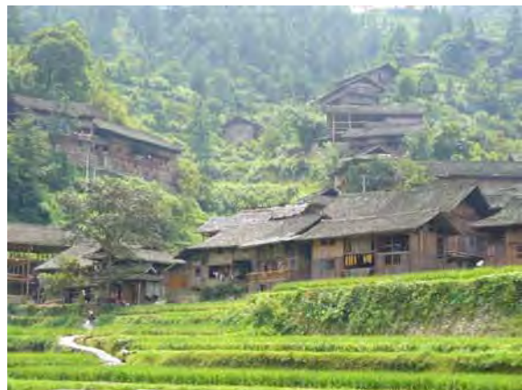
民族観光の成功地・郎徳上寨