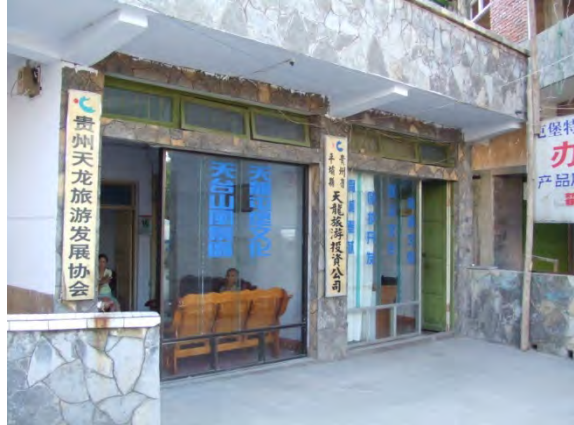
天龍屯堡古鎮の観光投資会社