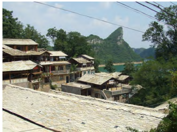
鎮山布衣族生態博物館（鎮山村）