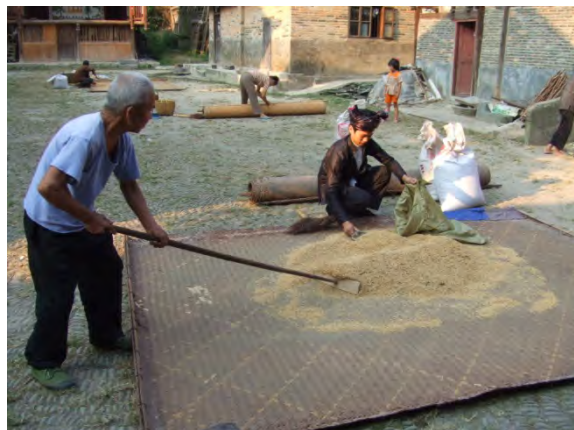
ショーを行う広場は農作業と共用（肇興村にて）

山村：もう一つ重要な点は、村落の中に、対外的な交渉をする共産党の“書記”のような方と、内部の住民を説き伏せる“鬼師”という職業の方というふたつのまとめ役・相談役がいました。これは外と内をうまく使い分けるしくみとも言える。日本だと1人のリーダーでそれをやろうとするのですが、貴州の例を見ていると、それはやはり無理ではないかと思いました。“書記”と“鬼師”というように、両方の車輪でうまくやらないと、土着の信仰や風習に根差した住民の意見をうまく調整できない。書記には、政治的な合理性というものが常に頭にありますよね。いわゆるタテマエです。観光開発というときには、対外的に交渉しなければならない。そういうときは共産党の“書記”が出ていくわけです。ただタテマエや理屈だけでは共同体は動かない。この理屈でわからないホンネの部分で“鬼師”のような土着の伝統的なリーダーが説き伏せていく。先ほど出てきた観光のライフサイクルによる分類とは別に、村の中の指示系統と