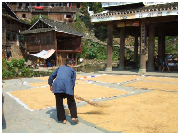
堂安村の鼓楼と泉のほとり

黒須：いろいろなことの中に、中国の特殊事情が見え隠れするんですが、その一つの例だと思ったのが、肇興の文化的なプロパガンダです。人民公社みたいな組織があって、そういう土壌があるから村の統一が図れるのだという考え方もあると思うのですが、それ