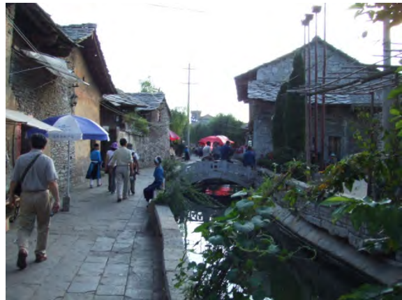
天龍屯堡古鎮のメインストリート

黒須：肇興への投資家は、そういう点ではなかなか文化に対する理解の高い人物のようですね。