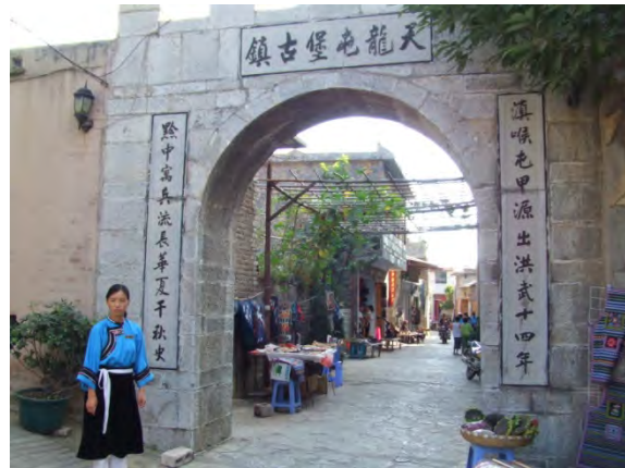
老漢族の村・天龍屯堡古鎮

山村：呉さんの話をみんなが聞くというのも、そういうところにあるかもしれませんね。