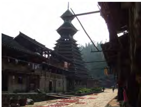
トン族の村で多く見られる鼓楼 (銀壇村)