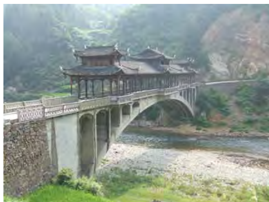
ミャオ族の村で多く見られる風雨橋 (南花村)