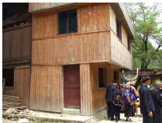
コンクリート造の家を木の板で隠す処理 (季刀村)