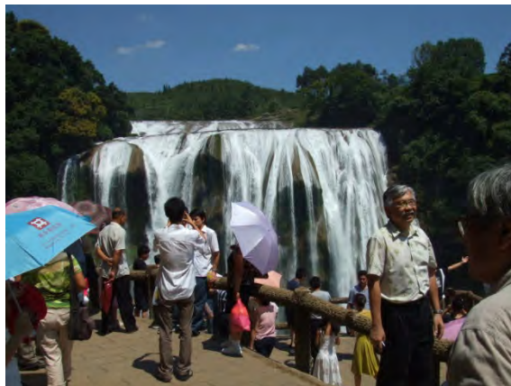
多くの国内観光客が押し寄せる黄果樹瀑布