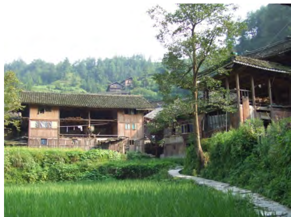
郎徳上寨の家並み

緒川：宮崎県に諸塚村というところがありまして、そこは人口が2千人ぐらいなのですが、村の自治公民館制度というのが全国的に有名で、村の権限を公民館にかなり委譲しているんですね。税金を徴収して徴税率100%を達成したり、林道網密度が日本一だったりしているのですが、その林道の計画、整備、維持などにも住民が参加している。グリーンツーリズムや神楽などの伝統文化の継承も公民館単位でやっている。その公民館が全部で16あって、昔は1公民館あたりちょうど500人ぐらい。今は過疎化で人口が減少してきて、200人弱になっている。そうなると、その公民館制