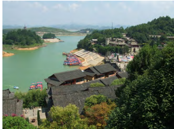
紅楓湖民族旅游村

次の日は、ミャオ族のエリアに入りました。そして青曼村で初めてミャオ族の歌と踊りの歓迎を受けました。ここでは、村の共産党書記に案内してもらい、話を聞くことができました。村では人民公社時代からの、“工分”の仕組みを応用した利益の配分システムがあり、それでうまくいっているということでした。また、本来、春耕の後に蘆笙を吹くと不作になるとされ、タブーとされてきたのですが、党書記自らが指示して、年中、吹くことができるようにしたということでした。