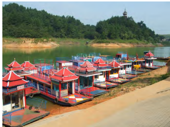
紅楓湖民族旅游村