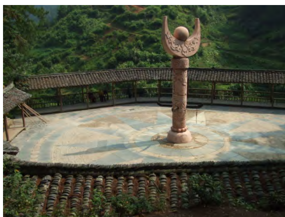
南花村の観光用広場