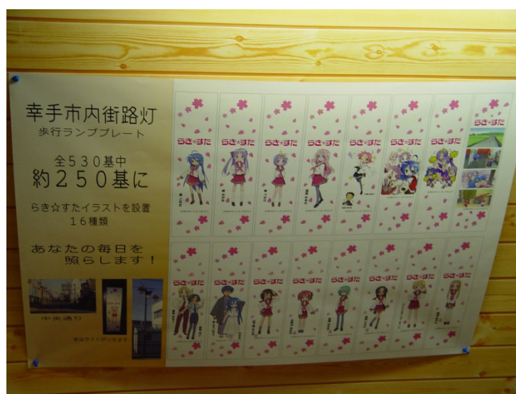
図-10 幸手市内街路灯歩行ランププレート

街路灯の歩行ランププレートがあります（図-10）。市内にこういう桜形の街路灯が530本ほどありますが、そのうち250本に、こういう歩行ランプのカバーを——アクリル製なんですけれども——16種類作って設置をいたしました。こちら当初はカメラでバシバシ撮るファンの方がいて、お店の人も「何かとんでもない物を商工会が付けたんだな」ということで、どう対応して良いかよくわからなかったということもあったそうです。でも実際こういう形で夜は暗くなると球切れしてなければライトがちゃんとついて、皆様の足元と明日を照らしますから、是非ともお越しください（笑）。