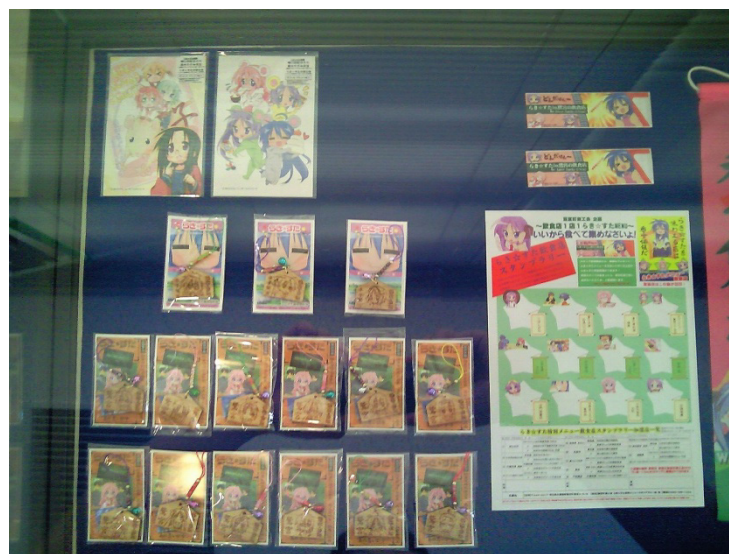
図-5 ポストカード、携帯ストラップ、スタンプラリー台紙、箸袋

そこから、最初のイベントについては角川さんの方からグッズについて色々アドバイスを受けました。絵馬ストラップの台紙の初期版には、みゆきさん（らき☆すたの登場人物）の絵が入っていたと思うんですけど、角川書店さんの方からそういったアドバイスをいただいて絵も提供していただきました。その後も様々な場面で御協力いただきました。スクラッチをやったりストラップの販売をしたり、ポストカード、らっきー☆SALE、売り出しもやっております。そして特別住民票交付式、飲食店スタンプラリー、先ほども出ました感謝祭、「らき☆すた神輿」ということで、角川書店さんに多大な協力をいただきました（図-5、図-6）。