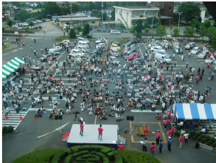
図-1 「萌フェス」の様子

ということですので、堅いプレゼンというよりも、ちょっと裏話的なものを交えながらやっていきたいと思います。まず、今日、「萌フェス」(図-1)を開催させてもらって、一番感じたことがあります。そのことからお話させていただこうと思います。