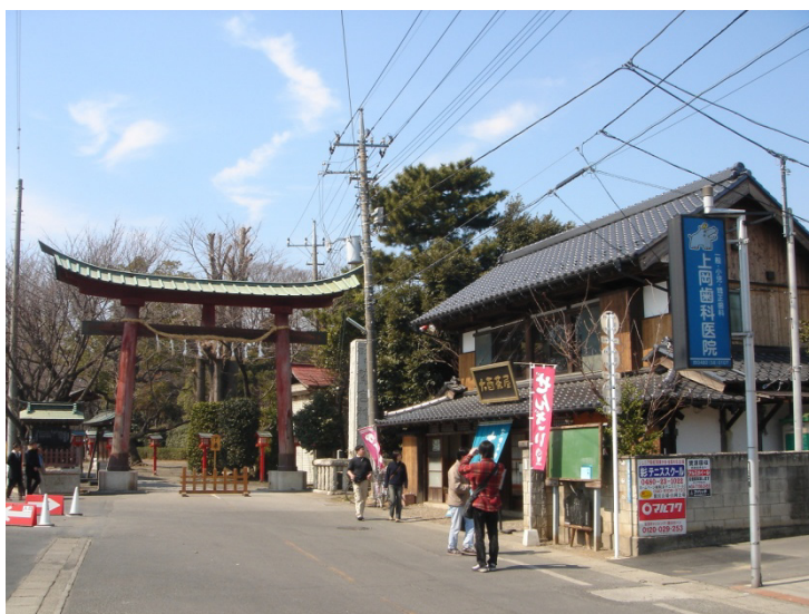
図-4 鷺宮神社と大西茶屋

鷺宮町は観光地ではないと思っておりましてので、県外から来るだけでも、非常に驚きなんです。わざわざそんな所から来てくれるんですかと。こんな何もない町にわざわざ来てくれるというのが、非常にありがたくて、何か御土産物が作れないかと考えました。どこの観光地に行っても、どこそこに行ってきたとか、お饅頭があったりする。何か作れないかなということで、松本と悩みました。