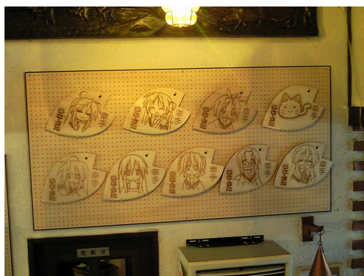
図-9 しあわせ CAFE Ami のストラップ特大オブジェ

しあわせ CAFE Ami というところを商工会で運営しているのですけれども、このカフェの中でサイン色紙を飾っています、あとストラップの特大オブジェ(図-9)というのを置いています。少しでも幸手に寄ってほしいなということでやっております。