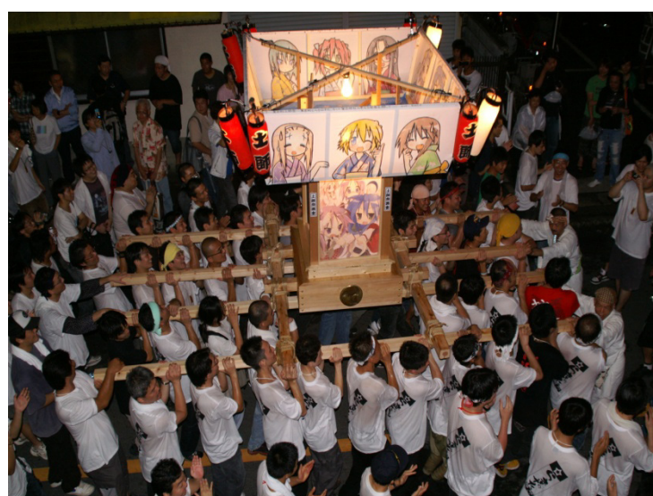
図-6 土師祭の「らき☆すた」神輿