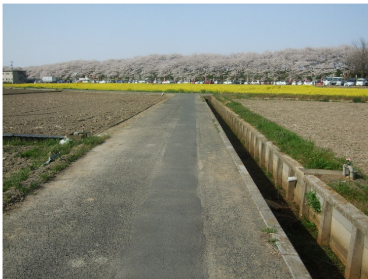
図-8 幸手市権現堂堤の桜

ちょっと観光のことに触れさせていただくんですけども、菜の花と桜のコントラストが綺麗な桜まつり（図-8）。これは毎年春に開催されてまして、2週間くらいで約70万人のお客さんに来ていただいております。