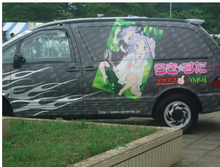
図-2 YMG1の痛車

そして、また余計な話ばかりになってしまうんですけども、面白い話を聞きました。今日、出店の中でYMG1さんという、痛車のカッティングシートを売っている業者の方が出ていたんですけど(図-2)、その方とお話していたら、次のようにおっしゃったんです。「いや、先ほどですね、多分、地元の方だと思うんですが、結構年配の方が来まして、『シールここで売っているのか。ちょっと欲しかったんだよ。悪いけど、買うから貼ってくんない。』ということで、4つシールをお買い上げいただいて、4面に貼って帰られたんですよ。」って言うんですよ。凄い話だなと思って、本当かなと思っていたんですが、私、先程歩いていたらその車を見かけて、つい運転手の顔を見たんですけど、正に65から70歳くらいのご年配の方でした。赤い車でしたね。皆さん、見かけたら優しく声をかけてあげてください(笑)。こんな良い話もありました。