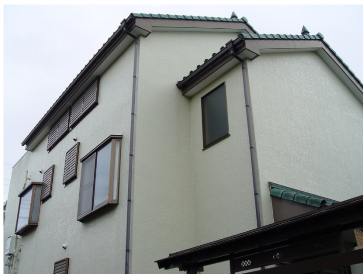
図-11 美水かがみギャラリー外観

それで、住民の方はどのようになるのか想定出来ないのが不安だということと、治安が悪くなったらどうするんだということ、こんなの困るからやめて欲しいというのがありました。ファンの方は殆ど礼儀正しい方です、というふうに説明させていただいたところ、近所に住んでいらっしゃる方も、ファンの方は良い方ですよということをおっしゃってくださいました。治安が悪くなったら商工会はどう責任を取るのか、責任取れません、ということだったんですが、説明会の会場にいる方に、殆ど賛同していただきました。幸手のまちおこしに犠牲を払おうということで、何とか了承していただいたというような形になります。