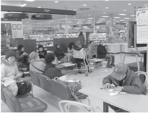
写真1 あかびら店の待合スペース

スを頻繁に利用している状況が確認できた。その中学生たちに話を聞くと、特に冬は屋外で球技や談話などができないため、週に2～3日ほどの頻度で放課後は体育館で遊んでおり、その後、あかびら店でパンなどの軽食を購入し、待合スペースでそれを食べながら友達と会話を楽しむことが習慣になっているとのことである。あかびら店がオープンするまでは、特に冬季に屋内で友達とゆっくりと過ごす場所がなかったため、放課後や体育館利用後はすぐに帰宅していたそうである。また、別の中学生からは、下校時に家族による迎えの車を待つために利用している、放課後や休日に友達と出かける際の待ち合わせ場所となっているなどの話も聞くことができた。