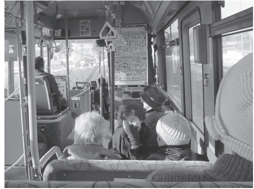
写真2 市内巡回バスの車内

同じく2010年2月に、巡回バスの利用実態調査も実施した。16座席ある34人乗りの巡回バスが、1日往復7便（昭和・幌岡コース4便、茂尻・平岸コース3便）毎日運行されている。車両自体はコープさっぽろの所有であるが、運行は北海道中央バスへ委託されており、あかびら店前を除く全ての乗降場所は、北海道中央バスの停留所となっている。利用者は市内の高齢者が中心であり、乗車してきた利用者は他の利用者と車内に掲示されているチラシを見ながら雑談